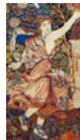
تصویر ۷- الهه‌ی ونوس در قالی رقص الهه‌ها (ملول: ۱۳۰۰:۱۳۸۴)