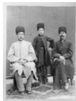
تصویر ۱۰- مردان دوران قاجار، (موسسه مطالعات تاریخ معاصر ایران (سایت: www.iichs.ir)

۱- مرد قاجاری: در هر ۴ گوشه‌ی قالی تصویر نیم‌تنه‌ی مردی با سبیل‌های باریک و کلاه‌ی قاجاری و سیاه بر سر دیده می‌شود. از پوشاک و کلاه مرد، مشخص است که وی یکی از مردان قاجاری زمانه‌ی حسن‌خان شاهرخی است (تصویر ۱۰). پیکره و نگاه مرد قاجاری موجود در قالی رقص الهه، در حالتی ایستا قرار دارد (تصویر ۱۱).