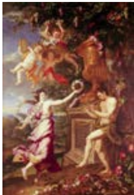
تصویر ۲- نقاشی رقص الهه و یک ساتیر، اثر الکساندر اوبلسکی

قالی «رقص الهه» را حدود ۹۵ سال پیش، استاد علی کرمانی ۲ بافته است. طرح فرش مزبور از گوبلن متعلق به ناصرالدین‌شاه اقتباس شده است که این گوبلن، مربوط به دوره‌ی لویی چهاردهم و از روی نقاشی الکساندر اوبلسکی (نقاش فرانسوی) به نام تابلوی «رقص الهه و یک ساتیر» اقتباس شده که در آن یکی از افسانه‌های روم (رقص الهه) به تصویر درآمده است (تصویر ۱ و ۲).