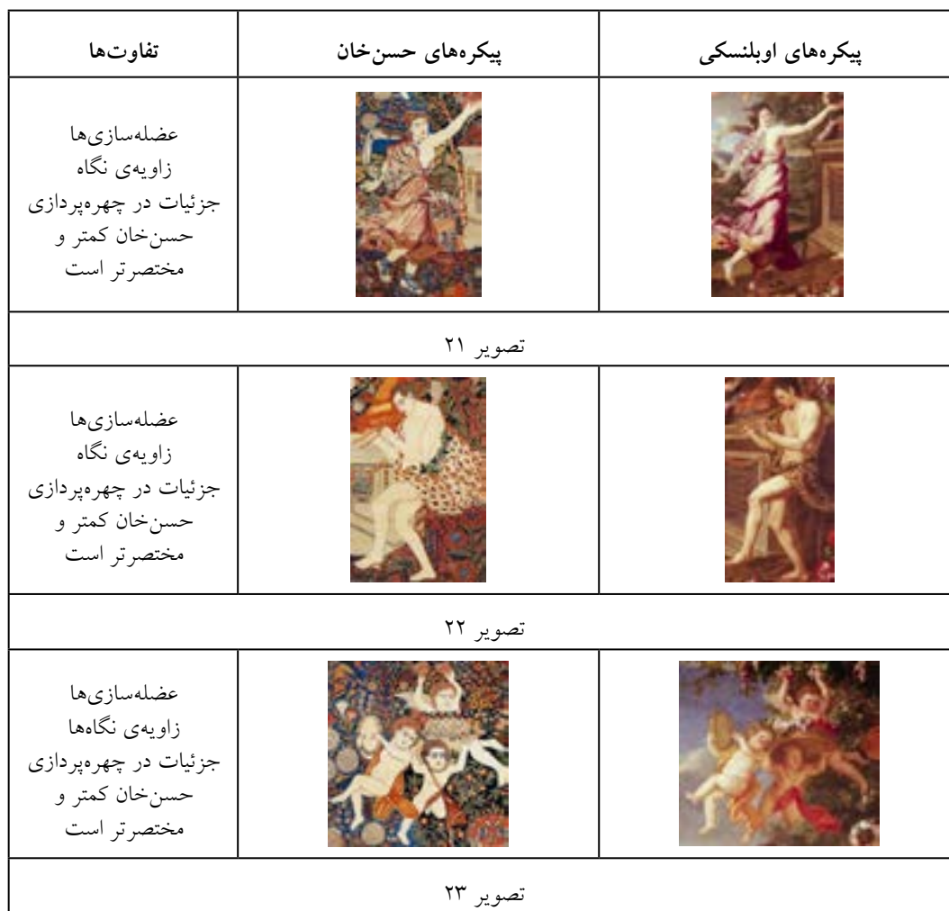
جدول ۴- مقایسه‌ی پیکره‌های موجود در قالی رقص الهه و پیکره‌های موجود در تابلوی اوبلنسکی