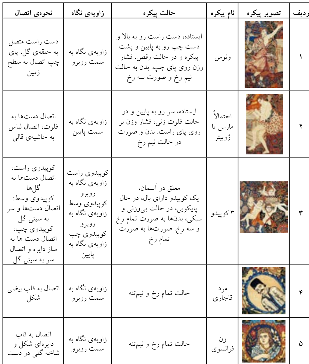
جدول ۱- تفکیک پیکره‌های موجود در قالی «رقص الهه»