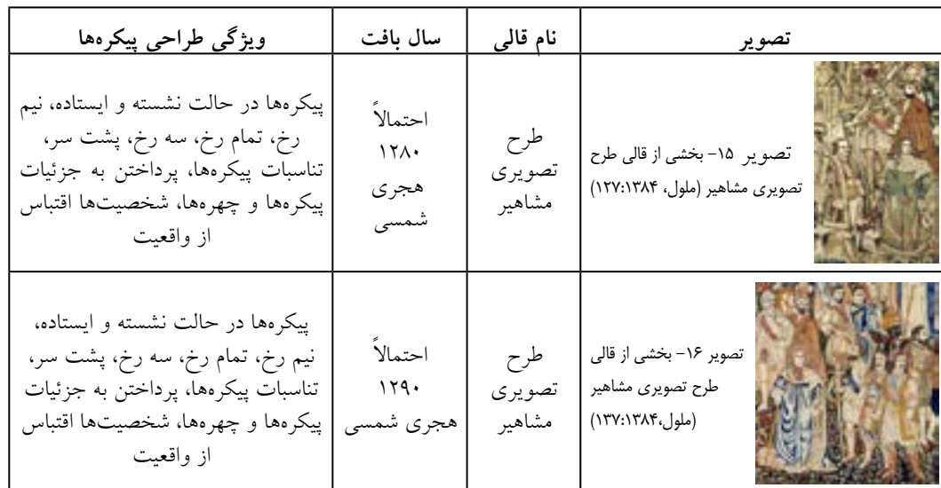
جدول ۳- نحوه‌ی طراحی پیکره‌ها در قالی‌های منسوب به حسن‌خان شاهرخی