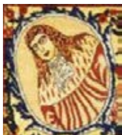
تصویر ۱۳ و ۱۴- طرح تصویری جفت آینه، طراح: حسن‌خان شاهرخی (ملول، ۱۳۸۴:۱۶۶)

دوفصلنامه علمی انجمن علمی فرش ایران شماره ۳۸ پاییز و زمستان ۱۳۹۹ ۱۰۶