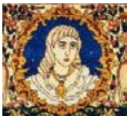
تصویر ۱۲- زن فرانسوی در قالی رقص الهه (ملول، ۱۳۸۴:۱۳۰)