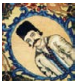
تصویر ۱۱- مرد قاجاری در قالی رقص الهه (ملول: ۱۳۸۴:۱۳۰)

۲- زن فرانسوی: در حاشیه‌ی این قالی، شش مرتبه تصویر نیم‌تنه‌ی زنی با موهای قهوه‌ای رنگ دیده می‌شود (تصویر ۱۲). او نیز نگاهی ایستا و شاخه گلی در دست دارد. لباس او بی‌شباهت با لباس ملکه‌ها و زنان متمول فرانسوی در قرن ۱۷ میلادی نیست. در حاشیه‌ی فرش‌ی مشابه با قالی رقص الهه‌ها که آن نیز توسط حسن‌خان طراحی شده است، تصویر پادشاهان فرانسوی (احتمالاً لویی چهاردهم) و زنی فرانسوی دیده می‌شود (تصویر ۱۴ و ۱۳).