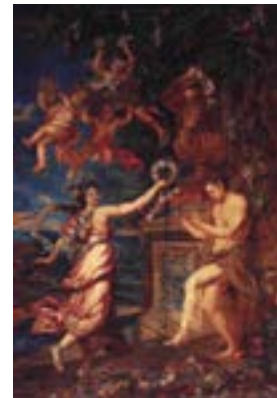
تصویر ۱- گوبلن مشابه با قالی «رقص الهه» متعلق به ناصرالدین‌شاه، موجود در کاخ گلستان (ملول: ۱۳۸۴:۱۲۹)