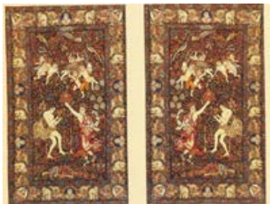
تصویر ۵- قالی مشابه با طرح رقص الهه، به سفارش محمدرضاخان. سال بافت (۱۶۸۰:۱۳۸۴) محل نگهداری: مجموعه‌ی خصوصی (ملول، ۱۶۸۰:۱۳۸۴)

توجه‌ای در حاشیه‌ی این دو قالی است که با یکدیگر متفاوت هستند (تصویر ۴). نمونه‌های مشابه دیگری از این قالی وجود دارد که تفاوت‌هایی با آن نیز دارند اما منشأ اصلی طرح آن‌ها از همان قالی «رقص الهه» گرفته شده است. حاشیه‌سازی و طراحی اجزای متن و به ویژه گل‌ها، به سبک آثار حسن‌خان شاهرخی و بافت و رنگ‌ندی آن به کارهای علی کرمانی شباهت دارد. قالیچه‌های شماره‌ی ۵ که تصاویر آن‌ها در کنار هم آمده جفت آینه هستند.