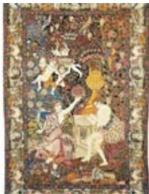
تصویر ۳- قالی رقص الهه به شماره اموال ۱۱۰، طراح: منسوب به حسن‌خان شاهرخی، موجود در موزه‌ی فرش ایران (آرشیو موزه ملی فرش ایران)

در متن این قالی ۵ پیکره دیده می‌شود. زنی در سمت چپ و مردی در سمت راست قرار گرفته‌اند. پشت سر آن‌ها ستون کلفت و سفید رنگی قرار دارد و گلدانی پر از گل بر روی آن نقش بسته است. در امتداد گل‌های فراوان و در قسمت بالا و سمت چپ قالی، پیکره‌ی ۳ فرشته نمایان است. این پیکره‌ها، شخصیت‌های اسطوره‌ای ۶ و افسانه‌ای رومی هستند. قالی دیگری به شماره اموال ۱۱۱ نیز در موزه‌ی فرش ایران وجود دارد که مشابه همین قالی است و رج‌شمار آن ۶۰ است. کتیبه‌ی این قالی نیز عمل محمدبن جعفر کرمانی است و بافت آن احتمالاً در اواخر قرن ۱۳ هجری قمری بوده است. تار و پود این قالی از نخ پنبه، پرز آن پشمی و نوع گره، گره نامتقارن است. نکته‌ی درخور