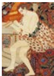
تصویر ۸- پیکره‌ی منسوب به مارس یا ژوپیتر در قالی رقص الهه‌ها (ملول: ۱۳۰۰:۱۳۸۴)