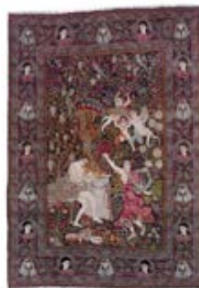
تصویر ۴- قالی رقص الهه به شماره اموال ۱۱۱، به ابعاد ۳۵۰ در ۴۹۸ سانتی‌متر

یک قالی مشابه دیگر با قالی «رقص الهه» نیز وجود دارد که نقوش آن عیناً تکرار شده و در موزه‌ی باغ نگارستان نگهداری می‌شود (تصویر ۶). شخصیت‌های اساطیری، از نقوش اصلی قالی «رقص الهه» محسوب می‌شوند.