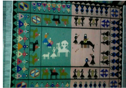
تصویر ۱۳- گلیم با نقش سور و سوگ در منطقه‌ی کوه‌دشت