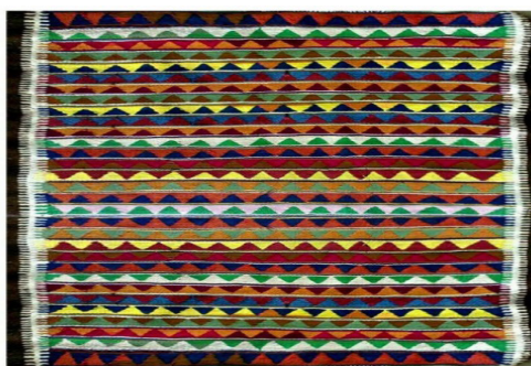
تصویر ۵- نقش مثلثی کوه در روی گلیم بافته شده (نگارندگان، ۱۳۹۹).