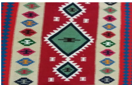
تصویر ۱۶- گلیم با نقش نقش حوض (نگارندگان، ۱۳۹۹)

نقش حوض (تصویر ۱۶) در طرح گلیم مناطق مختلف کوه‌دشت مشاهده می‌شود. در واقع می‌توان گفت از اصلی‌ترین نقوش گلیم لرستان است. هر گلیم می‌تواند یک یا بیشتر نقش حوض داشته باشد و تعداد حوض‌ها نیز بستگی به سلیقه‌ی بافنده دارند (رومی، ۱۳۸۹: ۵۲).