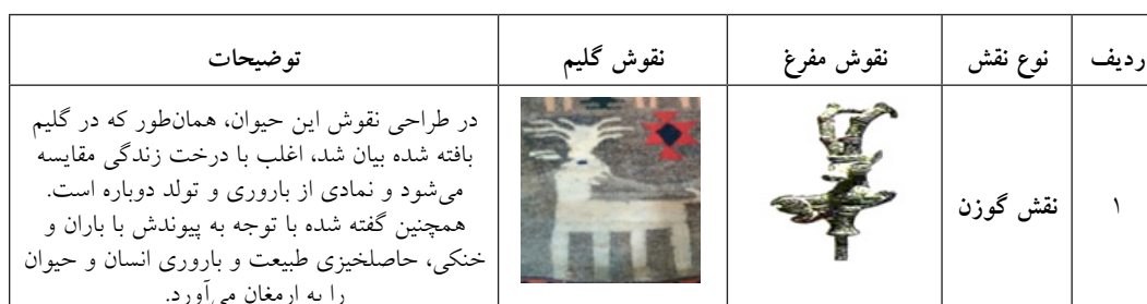
جدول ۱- مقایسه‌ی تطبیقی نقوش گلیم با فرم مفرغ‌های منطقه‌ی لرستان

در منطقه‌ی لرستان قدیمی‌ترین آیین موسیقی و رقص طبق کاوش‌های باستان‌شناسی بر روی نقوش صخره‌ای میرملاس و مفرغ‌ها به دست آمده است. رقص‌هایی که به صورت دسته جمعی توسط بافنده طراحی شده، به نوعی آزادگی آن‌ها را نشان می‌دهد. زمانی که پنجه در پنجه و بازو در بازوی یکدیگر هستند، نشان‌دهنده همبستگی، اتحاد و باهم بودن آن‌ها است و زمانی که پای می‌کوبند نشان‌دهنده این است که خاک سرزمین و وطن‌شان را عاشقانه می‌پرستند. این عمل دسته جمعی در میان اجتماعات نیمه متمدن سبب ایجاد هماهنگی و وحدت عمل در میان افراد قبایل و رابطه وحدت معنوی را در میان آن‌ها به وجود آورده است. هم‌چنین نقوشی هم به صورت آئینی و مذهبی و اسطوره‌ای در روی گلیم‌ها بافته شده مثل نقش گوزن و درخت زندگی، نقش الهه که بیشتر بر محور برکت، زاینده‌گی و باروری است که زندگی و معیشت مردم منطقه بر آن استوار است. نقوشی هم به صورت مذهبی به کار رفته مثل نقش حوض با اردک‌هایی در اطراف آن که نماد قداست و اهمیت آب در زندگی روستایی و کشاورزی منطقه است. هم‌چنین برای پی‌بردن به ریشه‌های نمادین بعضی از نقش‌های به کار رفته در روی گلیم‌ها با نقش‌های مفرغ‌های لرستان مورد مقایسه تطبیقی قرار گرفته است. به طور کلی و با توجه به تطبیق و مقایسه نگاره‌های گلیم با مفرغ‌های لرستان، می‌توان آن‌ها را به صورت زیر (جدول ۱) تحلیل نمود: