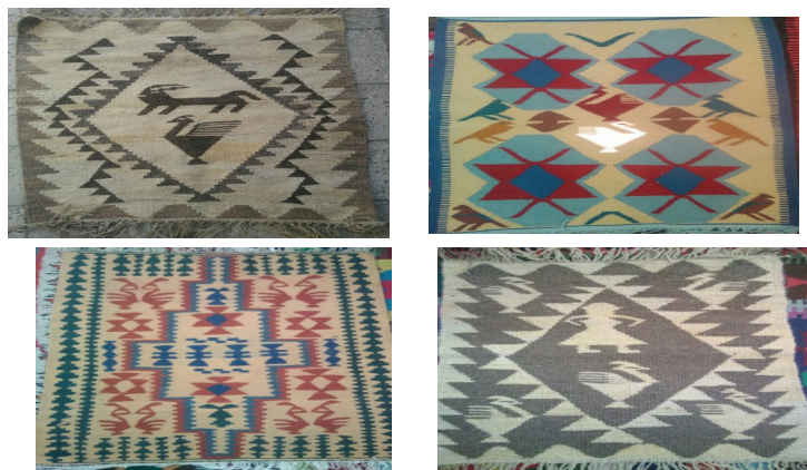
تصویر ۳- تنوع نقش خروس بر روی گلیم‌های بافته شهرستان کوه‌دشت (نگارندگان، ۱۳۹۹).

یکی دیگر از نقوش حیوانی که بر روی دست بافته‌های گلیم دیده می‌شود، نقش خروس است. صدای خروس یادآور اشعه‌ی خورشید است. او با بهرام، خدای جنگ مرتبط بوده، هم‌چنین سنبل رجولیت است. بنا به اعتقادات بعضی از اقوام، خون خروس در مراسم قربانی بسیار مؤثر است (یعقوب‌زاده و خزائی، ۱۳۹۸: ۴۸). خروس از مرغان مقدس به شمار می‌رود و آن را به فرشته‌ی بهمن اختصاص داده‌اند (میرمحمدی تهرانی، ۱۳۸۰: ۹۱). یکی از خصلت‌های خروس این است که دوست دارد در همه جا حضور داشته باشد و برتری خود را به بقیه نشان دهد (همتی‌پور گشتی، ۱۳۹۱: ۶۸). در تعدادی از گلیم‌های بافته شده در شهرستان کوه‌دشت، نقش این حیوان با رنگ‌ها و فرم‌های متفاوت بافته شده است (تصویر ۳).