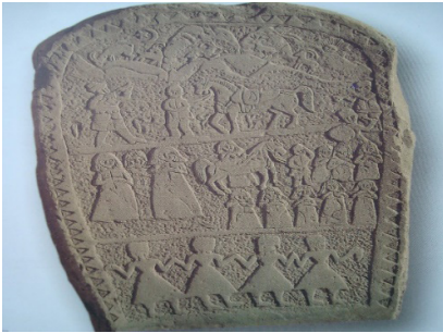
تصویر ۱۴- نقش سور و سوگ در سنگ گورهای لرستان (نگارندگان، ۱۳۹۹)