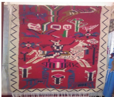
تصویر ۲- گلیم بافته شده با نقش اسب سوار.

در اسطوره‌ها و مراسم مذهبی بسیاری از تمدن‌ها، اسب مقام شامخی دارد. در وهله‌ی نخست این حیوان نماد خورشید است که گردونه‌ی ماه آن را می‌کشید و برای خدایان خورشید قربانی می‌شد. به این ترتیب اسب، هم یک نماد حیاتی و هم یک نماد مرگ در رابطه با خورشید و ماه است. همچنین نماد هوش، فکر، حکمت، چابکی، سرعت اندیشه، گذر سریع حیات، ماهیت فراست حیوانی و غریزی، نیروهای سحرآمیز غیب‌گویی، باد و امواج دریا است (قسیمی، ۱۳۹۷: ۱۰۷). قرار دادن دهنه‌ی اسب در کنار مردگان در واقع بیانگر این موضوع است که مردم لرستان مانند قبایل جنوب روسیه و اروپای مرکزی و شمالی، معتقد بودند که انسان پس از مرگ به اشیائی که در زندگی مورد استفاده او قرار گرفته، نیاز پیدا می‌کند. مثلاً سیت‌ها هنگام دفن پادشاهان و بزرگان خود، ارابه و اسب‌هایشان را هم در کنارشان دفن می‌کردند. مردم لرستان نیز علاقه زیادی به اسب داشته‌اند و در نتیجه با وجود همین حیوان بود که می‌توانستند بر سومری‌ها غلبه کنند، اما چون قربانی کردن یک یا چندین اسب برای هر کسی مقدور نبوده، دهنه اسب را به جای خود حیوان در قبر می‌گذاشتند (منصورزاده، ۱۳۹۷: ۹۷). علی‌رغم این‌که شاید پرورش اسب و بعضی حیوانات در سرزمین جبال و اطراف زاگرس توسط اجداد لر بوده، تولید بعضی از انواع زیراندازها مخصوصاً گلیم نیز با توجه به قدمت تاریخی این منطقه در ادوار باستانی در این منطقه صورت گرفته باشد (تصویر ۲).