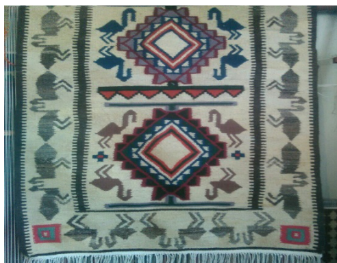
تصویر ۴- گلیم با نقش اردک (نگارندگان، ۱۳۹۹).

آن بوده نماد مرغابی سانان را نقاشی می‌کرده است (کریمی، ۱۳۹۸: ۲۳). نماد مرغابی سانان در هنر ایرانی در یک سیر تاریخی مداوم قرار گرفته و در هر برهه با توجه به اقتضای اعتقادی و باور زمانه‌ی مورد استفاده قرار گرفته است. با ورود اسلام و تحول در باور ایرانیان نماد مرغابی سانان نیز، اگرچه هم‌چنان به حیات خود ادامه می‌دهد، بیشتر جنبه‌ی تزئینی در هنر ایرانی به خود می‌گیرد که با معنی اولیه‌ی آن متفاوت است (همان: ۳۱).