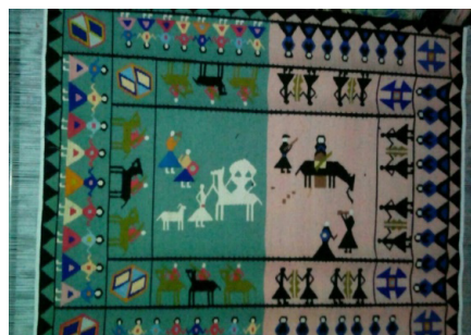
تصویر ۱۳- گلیم با نقش سور و سوگ در منطقه‌ی کوه‌دشت