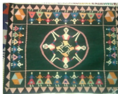
تصویر ۱۱- گلیم بافته شده با نقش رقص لری (نگارندگان، ۱۳۹۹) تصویر ۱۲- طرح سر پرچم با نقش رقص لری از جنس مفرغ (ذکاء: ۱۳۴۲: ۵۸)