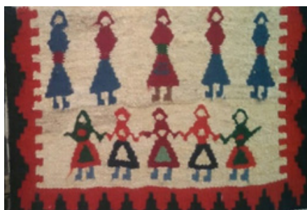
تصویر ۱۰- نقش گروهی از زنان و مردان بر روی نقش گلیم (نگارندگان، ۱۳۹۹).

در بین مردمان ابتدایی، دامنه حرکاتی که در رقص به کار گرفته می‌شود، بسیار وسیع بوده به صورتی که تمام قسمت‌های بدن از سر و سینه، پشت، سر، پاها، بازوها، دستان، عضلات صورت، چشم، ابرو و مو همه بازی گرفته می‌شد و با حرکت هر یک از آنها منظور و معانی مخصوص را می‌رساندند. رقص و اجرای حرکات موزون در میان اجتماعات بدوی و نیمه بدوی متمدن محرک اعمال و حرکات دسته جمعی و در نتیجه مولد هم آهنگی و وحدت عمل در میان افراد قباایل می‌گردید و همین وحدت دسته جمعی، یک نوع وحدت هنری را موجب می‌شد بسیار مطلوب بوده و بخش مهمی از اوقات و فعالیت آنان را به خود اختصاص می‌داده است (ذکاء، ۱۳۴۲: ۴۵). استفاده از تصاویر انسانی (رقص و سواره) در گلیم‌های کوه‌دشت قابل توجه است. یکی از این تصاویر (۱۰) نقش دو گروه از زنان و مردان بوده که به صورت دو ردیف نقش شده است. در ردیف بالایی تصویر ۵ مرد به حالت ایستاده نقش گردیده و در ردیف پایین نقش ۵ زن که دست در دست یکدیگر به حالت رقص گروهی نشان داده شده است. این گلیم در منطقه‌ی شهرستان کوه‌دشت بافته شده است.