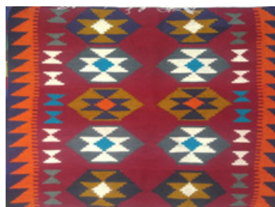
تصویر ۶- گلیم با نقش گل قندانی (نگارندگان، ۱۳۹۹).