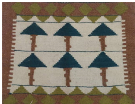
تصویر ۸- گلیم با نقش درخت سرو