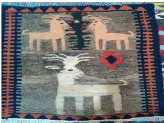
تصویر ۹- نقش درخت زندگی همراه با گوزن بر روی گلیم (نگارندگان، ۱۳۹۹)

یکی از موضوعات رایج در نقاشی‌های تزئینی ایرانی، درخت زندگی است که آن را در میان دو حیوان روبه‌روی هم ترسیم کرده‌اند. در تصویر (۹) طرح یک گلیم که در فرهنگ ایرانی به درخت زندگی مشهور بوده، مشاهده می‌گردد. در دو سوی این درخت؛ نقش دو گوزن بافته شده و در قسمت پایین این طرح، یک گوزن دیگر با رنگ متفاوت از نقش بالایی نشان داده شده است.