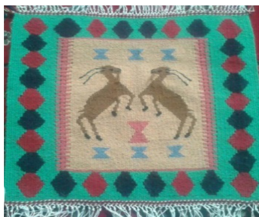
تصویر ۱- گلیم بافته شده با نقش بزکوهی (نگارندگان، ۱۳۹۹).