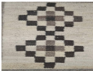
تصویر ۷- گلیم با نقش گل پتویی (نگارندگان، ۱۳۹۹).

نقوش گیاهی نیز بر روی گلیم‌های این منطقه دیده می‌شوند. عمده‌ترین نقوش گیاهی که در گلیم‌ها به کار می‌روند؛ عبارت‌اند: از گل قندانی، لاله‌عباسی، گل خرچنگی و گل پتویی (تصاویر ۶ و ۷).