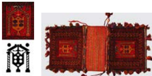
تصویر ۱- خورجین عشایری با نقش تصویری

نمایش پیکره‌ی انسان در دست‌بافته‌های بختیاری‌ها بسیار دیده شده و قابل تأمل است. این‌گونه خورجین‌ها با نقش تصویری که دارند، جزو ذهنی بافی‌ها و بداهه بافی‌ها محسوب می‌شوند و در واقع بافنده، با توجه به داستان‌ها و اتفاقات روزمره و سفرها و گفتمان‌های بین جمعیت طایفه‌ای خود؛ به تجسم آن نقش در ذهن خود دست یافته است. تصویر متعلق به یک خورجین تصویری عشایری است که با دو شیوه‌ی بافت، رویه شیوه‌ی فرش بافی پرزدار و زیره‌ی آن شیوه‌ی گلیم بافت ساده و شیراز پیچی موی بز بافته شده است. نقش مرکزی بر زمینه‌ی لاک‌ی خورجین اصطلاحاً نقش گنبدی یا مسجدی است و در پایین دسته‌های نقش، پنجه‌ی دو دست قرینه را مشاهده می‌کنیم؛ که حضور این نقش پنجه‌ی دست، نشانه‌ای از اعتقادات مذهبی و تصورات ذهنی بافنده است. بر اساس تحقیقات میدانی و طبق گفته‌ی بافندگان و خبرگان محلی دریافتیم که استفاده از این‌گونه نقش‌ها و