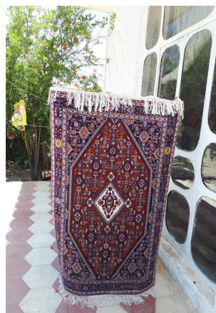
تصویر ۸- قالی با طرح ماهی درهم کرمانی (نگارندگان)