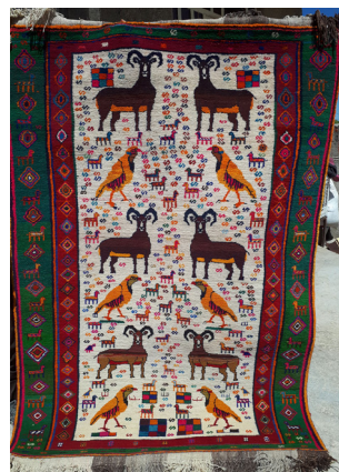
تصویر ۱۳- الگو برای زمینه قالی (نقش قوچ) در تصویر ۱۲

تأسیس اتحادیه‌ی تعاونی قالی دست‌باف ۷ و راه‌اندازی صنف بافندگان در آگاه کردن بافندگان در تمامی امور بافندگی ز جمله‌ی مقدار دستمزد، شناخت بازار، قیمت واقعی قالی، مواد اولیه و بالا بردن کیفیت بافت با برگزاری کلاس‌های به‌بافی، بسیار مؤثر بوده