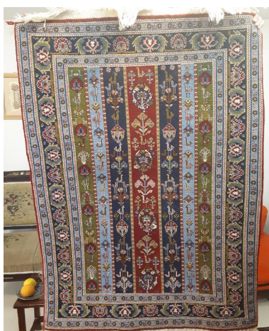
تصویر ۵- قالی با طرح محرمات (نگارندگان)

طرح‌های شهری را فراوان برگرفته و در گره بافته‌های خود به کار بسته‌اند» (پرهام، ۱۳۷۵: ۲۹). طرح‌های محرمات (تصویر ۵)، حوض در حوض عرب چرپانلو (تصویر ۶)، یک‌سر ناظم کشکولی (تصویر ۷)، ماهی درهم (تصویر ۸)، لچک ترنج (چهار چاپق) در ترکیب با نقش مایه‌های گیاهی منظم، از نمونه طرح‌های رایج در تولیدات اخیر فیروزآباد است که البته امروزه غالب آن‌ها به صورت منظم و متقارن بر روی قالی‌ها نمود یافته‌اند.