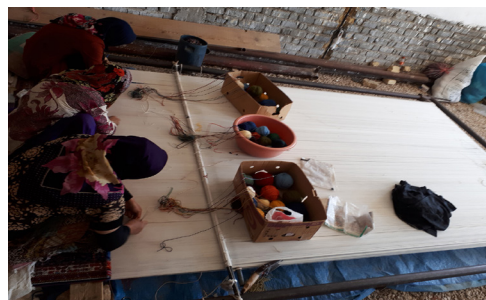
تصویر ۴- بافت قالی در روستای جایدشت

البته در دوره‌ی یکجانشینی، وضعیت تولید قالی در تمامی روستاهای منطقه‌ی فیروزآباد به یک شکل نمی‌باشد به عنوان نمونه در روستاهای جایدشت و بایگان بافت قالی به عنوان یک کار تمام وقت محسوب می‌شود و بعضی از دخترها و زن‌ها در خانواده تنها به کار بافندگی مشغول هستند (تصویر ۴).