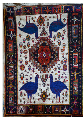
تصویر ۱۴- الگو برای ترنج قالی در تصویر ۱۲ (نگارندگان)

۲- با استفاده از نقشه‌های کاغذی؛ در این شیوه قسمت‌های مهم یک نقشه به صورت نقشه شطرنجی به ابعاد حدود ۵۰*۵۰ سانتی‌متر آماده شده و در اختیار بافنده قرار می‌گیرد؛ البته ساختار و شکل این نقشه‌ها کاملاً متفاوت از نقشه‌های شطرنجی قالی‌های شهری باف می‌باشد، در این نقشه‌ها تنها نقش‌مایه‌های اصلی و گوشه‌هایی از شکل ترنج و حاشیه‌ی قالی به صورت نقطه‌شده دیده می‌شود و معمولاً رنگ‌بندی خاصی را نیز به بافنده پیشنهاد نمی‌دهد. در این شیوه نیز خود بافنده با توجه به تجربه‌ی خود می‌تواند