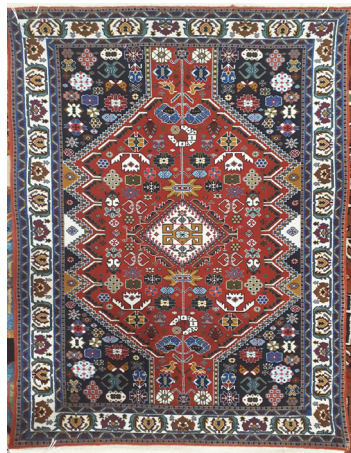
تصویر ۳- قالی فیروزآباد با طرح گیاهی به صورت قرینه (نگارندگان)

جایگزین شدن مواد اولیه‌ی یک‌دست ماشینی به جای مواد اولیه‌ی دست‌ریس باعث افزایش سرعت بافنده در بافت شده است. گستردگی تولید قالی در روستاهای فیروزآباد و روی آوردن تولیدکننده‌ها به رواج طرح‌ها و نقشه‌های آماده جهت بافت، بعد از چند مدت ماندگاری نقش و نگاره‌های سنتی قالی قشقایی در تولیدات این روستاها را سبب شده است؛ این سری از نقوش که در گذشته بیشتر در قالب‌های غیر منتظم در یک قالی نمود پیدا می‌کرد امروزه به صورت کاملاً قرینه رایج شده است. نمونه‌های زیادی از این قبیل نقوش در طرح لچک ترنج دیده می‌شود (تصویر ۳).