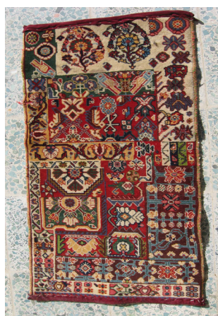
تصویر ۱۱- دستور (نگارندگان)

ب) در بعضی مواقع بافنده یک قالی بافته شده کامل را به عنوان نقشه مورد استفاده قرار می‌دهد و آن