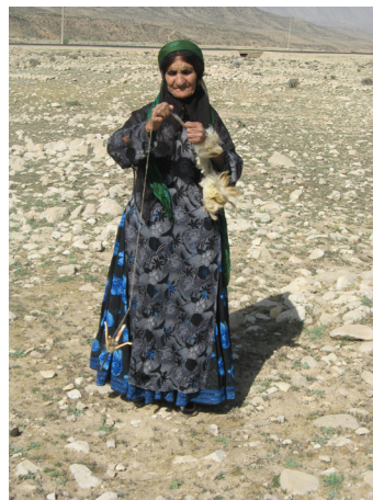
تصویر ۲- پشم‌ریسی با دوک نخ‌ریسی (نگارندگان)

در هنگام کوچ‌نشینی یک بافنده می‌بایست تمام مراحل آماده‌سازی مواد اولیه و بافت اعم از ریسیدن (تصویر ۲)، تابیدن، رنگ‌رزی و چله‌کشی را خود و یا با همکاری همسایگان و بستگان انجام داده و هر کدام از این مراحل با صرف زمان زیادی انجام می‌گرفت و همه‌ی عوامل و مشکلات مانع از بافت بیش از یک الی دو تخته قالی توسط یک خانواده در یک سال می‌شد.