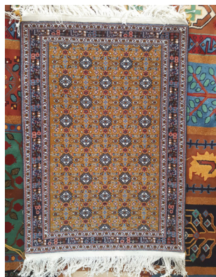
تصویر ۹- قالی با طرح ماهی درهم کرمانی کوچک (نگارندگان)

عوامل متعددی را می‌توان در نمود متقارن طرح‌های در اصل نامتقارن در قالی‌های فیروزآباد و تمایل بافندگان به بافت طرح‌های قرینه ردیابی نمود: - منتقل شدن تولید قالی به کارگاه‌های قالی‌بافی متمرکز؛ به عنوان مثال در منطقه‌ی جایدشت کارگاهی متمرکز با سابقه‌ی حدود پنجاه ساله در تولید قالی وجود دارد.