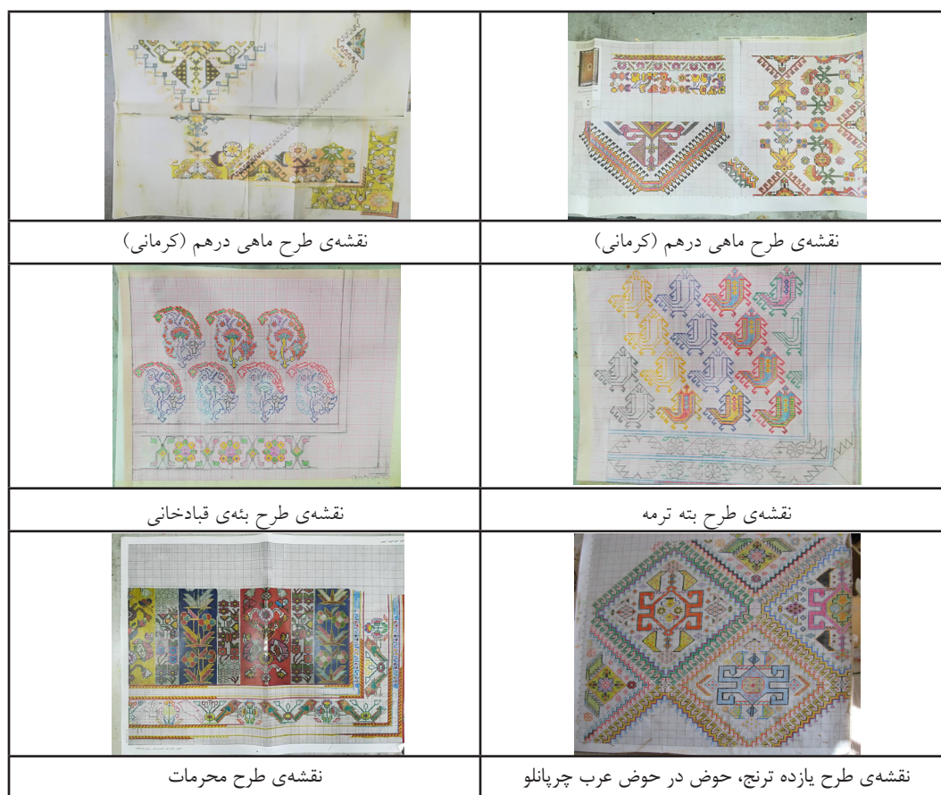
جدول ۴- تعدادی از نقشه‌های مورد استفاده در بافت قالی‌های امروزی شهرستان فیروزآباد

از جمله فاصله گرفتن تدریجی از اصالت قالی که خود در جنبه‌های گوناگون قابل بررسی است. گستردگی و تنوع رنگ و ریزه‌کاری‌های رنگ‌آمیز قالی‌ها و پابندی به اصل تضاد در رنگ‌گزینی در قالی‌های زمان کوچ‌نشینی آن قدر بالا بود که کارشناسان در تشخیص رنگ‌های گیاهی و شیمیایی دچار تردید می‌شدند، چیزی که در تولیدات امروزی کمتر شاهد آن هستیم. به دلیل رواج گسترده‌ی نقشه‌های قالی (جدول ۴) در دوره‌ی یکجانشینی، امکانات ذهنی بافی و دامنه خیال‌پردازی بافنده در نقش‌پردازی قالی نسبت به