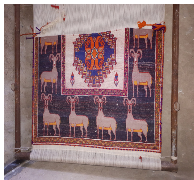
تصویر ۱۲- قالی در حال بافت روستای نجف‌آباد طایفه چگینی