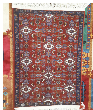
تصویر ۱۰- قالی با طرح ماهی درهم کرمانی بزرگ (نگارندگان)

را به صورت برعکس، به گونه‌ای که از پشت آن گره‌ها قابل شمارش باشد در کنار دار بافندگی خود قرار داده و طرح و رنگ آن را به صورت نسبتاً دقیقی بر روی قالی خود منتقل می‌کند؛ در این موارد بافنده گاه با توجه به سلیقه‌ی خود در طرح و رنگ تغییرات جزئی انجام می‌دهد. در مواردی دو یا سه تخته قالی به عنوان الگو و دستور یک قالی مورد استفاده قرار می‌گیرد. تریج را از روی یک قالی، حاشیه از روی قالی دیگر و زمینه را از روی قالی سوم مورد الهام قرار می‌دهد. این مورد در روستای نجف‌آباد در تیره‌ی چگینی مشاهده شد (تصویر ۱۲، ۱۳، ۱۴).