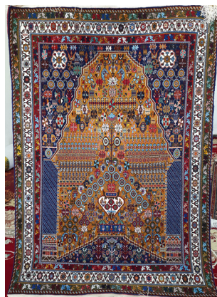
تصویر ۷- قالی با طرح یک سر ناظم کشکولی (نگارندگان)

تمامی این دلایل باعث شده است که قرینه‌سازی طرح‌هایی که در اصل نامتقارن بوده مثل قالی‌های با طرح‌های غیرمنتظم، در تولیدات امروز منطقه‌ی فیروزآباد رواج گسترده یابد. به عنوان نمونه نقش‌مایه ماهی درهم از طرح‌های متداول امروزی که در شهرستان فیروزآباد به «کرمانی ۱ » معروف است. در قالی‌های سال‌های اخیر این منطقه نسبت به گذشته تغییر نموده به دو صورت قابل مشاهده است؛ کرمانی کوچک (تصویر ۹) و کرمانی بزرگ (این نوع هنوز کوچک‌تر از اندازه‌ی سابق است) (تصویر ۱۰). این طرح امروزه به صورت بسیار منظم و سراسری و یا همراه با ترنج کوچکی در مرکز قالی دیده می‌شود. رنگ زرد و قرمز از رنگ‌های رایج زمینه‌ی این طرح می‌باشد.