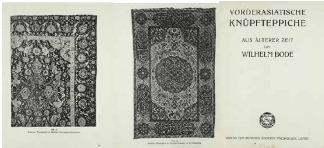
تصویر ۱۱ و ۱۲ و ۱۳: برگ‌هایی از کتاب «فرش‌های عتیقه دوران گذشته» نوشته فون بده، (۱۹۰۲ م). منبع: Von Bode, Wilhelm. Vorderasiatische knüpfteppiche aus älterer zeit, Leipzig, 1902

متمركزند و نقوش گروه دوم در جهت طولی فرش. كونل در «هنر اسلامي» مي‌كوشد فرش‌هاي صفوي را به مناطقي از ايران نسبت دهد گرچه دقيق نباشد. منبع كونل در اين انتساب‌ها بسيار وامدار كتاب فردريك روبرت مارتين (۱۸۶۸-۱۹۳۳) ۱ با نام «تاريخ فرش‌هاي شرقي پيش از ۱۸۰۰ ميلادي» ۲ است كه در سال ۱۹۰۶ منتشر شده است. براي نمونه كونل فرش‌هاي موسوم به گلداني را به كاشان و فرش‌هاي باغي را به شمال ايران منسوب كرد. همچنين كوشيد به ريشه‌يابي طرح و نقوش فرش‌هاي صفوي پردازد و کاربري فرش‌ها را هم حدس بزند. چنانكه درباره فرش‌هاي گلداني بر اين باور است كه به سبب جهت‌دار بودن و نقوش گياهي‌شان در نمازخانه و براي تعيين جهت قبله به كار مي‌رفته‌اند و فرش‌هاي باغي برگرفته از طرح باغ‌هاي ايراني بوده‌اند و فرش‌هاي ترنج‌دار از شمسه‌هاي تذهيب و تجليد در كتاب‌آرآيي الهام گرفته و استفاده مذهبي داشته‌اند. همچنين فرش‌هاي شكارگاه را داراي کاربرد غيرمذهبي مي‌دانند (كونل، ۱۹۰-۲۱۱). او پا را از اين نيز فراتر مي‌گذارد و مي‌كوشد طراحان فرش‌هاي صفويه را نيز از ميان نگارگران پراوازه آن دوره بيباد: «نقطه اوج اين گونه تزئينات حيواني در فرش‌هاي I. Fredrik Robert Martin