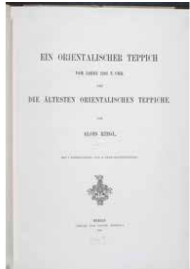
تصویر ۸ و ۹ و ۱۰: برگ‌هایی از کتاب «فرش‌های عتیقه شرقی» نوشته ریگل. منبع: Riegl, Alois. Altetrn orientalischen Teppiche . (Reprint 1979 ed.), A. Th. Engelhardt, 1892