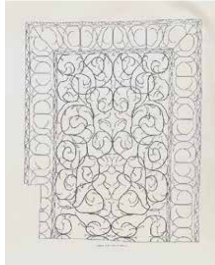
تصویر ۱۵ و ۱۶: برگ‌هایی از کتاب «فرش‌های کهن شرقی» نوشته زاره (۱۹۰۸ م).

«تاریخچه» با این جمله آغاز می‌شود: «هنر ایران در مغرب زمین به مدت چند قرن بیش از هر چیز به قالی ایرانی نام‌بردار و شناسا بوده است» (پوپ، ۱۳۸۹: ۲۶۰۷). پوپ آشکارا همانند ریگل شیفته فرش‌های صفوی است: «فرش‌های شرقی بازار اروپا همه بافته از پشم بود و رنگ‌های محدود داشت و طرح‌ها و نقش آن‌ها کمابیش خشن و خالی از ظرافت، و نیز دلگیر و فاقد تابناکی و ظرافت دلپسند دستبافته‌های ایرانی» (همان). او در بررسی فرش‌های ایرانی به نقاشی‌های اروپاییان و نگاره‌های ایرانی همانند اسلافش چون لسینگ، فون‌بده و معاصرانش کونل و دیماند بسنده نکرد؛ سفرنامه‌های اروپاییانی را که به ایران سفر کرده بودند همچنین نوشته‌های تاریخ‌نویسان ایرانی را جست‌وجو کرد و از دل آنان استنادات تاریخی بیرون کشید گرچه خودش می‌نویسد: «در این نوشته‌ها، جست‌گریخته، اشاره‌های ناچیزی به فرش و فرش‌بافی شده است. گرچه بیشتر این اشاره‌ها کم‌محتوا هستند و اطلاع زیادی به ما نمی‌دهند» (همان: ۲۶۲۹). پوپ در تاریخ‌گذاری و انتساب فرش‌ها به جغرافیای بافت رویکرد دوگانه‌ای دارد. از سویی محتاط است و همه جنبه‌ها را در نظر می‌گیرد و می‌کوشد بسیار علمی