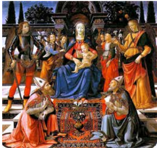
تصویر ۵: سنت زئوبوس و سنت ژوستوس، مریم (ع) و مسیح (ع) را می‌ستایند، نقاش: دومینیکو گِرلاندايو، ۱۴۸۳ م. منبع: