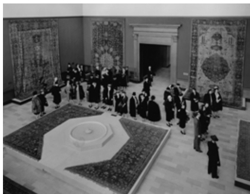
تصویر ۱۷: نمایشگاه هنر اسلامی، شیکاگو، ۱۹۴۷.

۱۳۸۹: ۲۶۲۰). شاید هیچ کتابی به اندازه «بررسی هنر پرشیا» و «قالی ایران» نوشته سیسیل ادواردز بر سبک کار پژوهشگران ایرانی تأثیر نگذاشته باشد. در آلمان جدی‌ترین منتقد پوپ، کورت اردمان (۱۹۰۱-۱۹۶۴) به مدیریت بخش اسلامی موزه برلین رسید که ادامه‌دهنده «مکتب برلین» بود. او استاد هنر اسلامی در دانشگاه برلین، بن، قاهره، هامبورگ و از سال ۱۹۵۱ تا ۱۹۵۸ استاد دانشگاه هنر اسلامی استانبول بود. دوره‌ای که احتمالاً نقش بسیاری در جهت‌گیری فکری او به سوی هنر آناتولی داشت. هنر ساسانیان و فرش دو زمینه اصلی علاقه او بودند. «زاره در ۱۹۲۸ یکی از جستارهای کتاب نمایشگاه وین را به اردمان سپرد. او نیز تسلط خود را بر فرش نشان داد و پس از آن مطالعات جدی‌اش را در این باره آغاز کرد» (Jens KR, 2012). در ۱۹۵۵ تاریخ نوین فرش‌های شرقی را پایه گذاشت و به وضوح در پی یافتن پاسخی قانع‌کننده برای پرسش‌های بی‌شمار خود از گذشته برآمد. این موضوع را به‌خوبی می‌توان در کتاب او با نام «تاریخ اولیه فرش‌های ترکی» مشاهده کرد. سپس به ترکیه رفت و ادامه پژوهش‌هایش را در آن‌جا پیگیری کرد. اردمان بر خلاف پوپ که تاریخ نخستین فرش‌ها را به ایران می‌رساند، مبدأ تاریخ فرش را در آناتولی می‌جست. تاریخ‌نگاری اردمان درباره فرش بر پایه دو فرضیه بنا شده بود. نخست فرش‌های سلجوقی که یولیوس هاری ۱. اردمان هیچ‌گاه قالی‌پازیریک را از نزدیک ندید اما بر نظر مبنی بر پارچه بودن آن پای فشرده. اقبالی که اردمان در ترکیه دارد همانند جایگاهی است که پوپ در ایران برخوردار است.