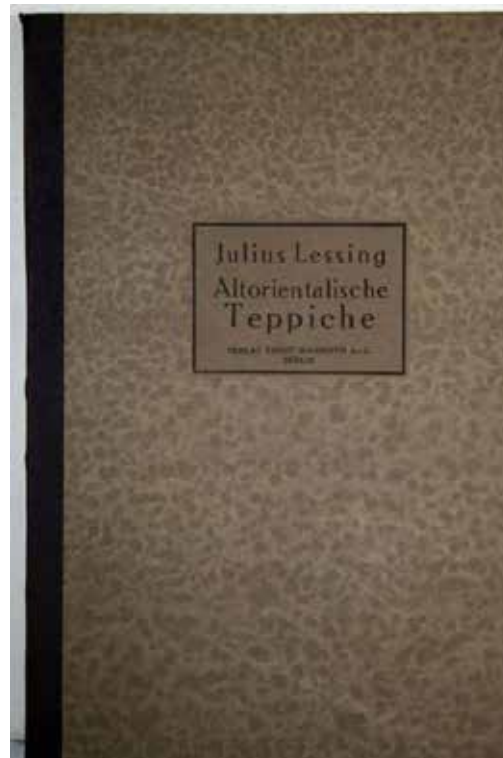
تصاویر ۳ و ۴: جلد کتاب «فرش‌های شرقی در تابلوهای غربی سده‌های پانزدهم و شانزدهم میلادی» نوشته لسینگ (۱۸۷۷ م). منبع: Lessing, Julius. Altorientalische Teppichmuster: Nach Bildern und Originalen des XV. - XVI. Jahrhunderts gezeichnet von Lulius Lessing, E. Wasmuth, Berlin 1877