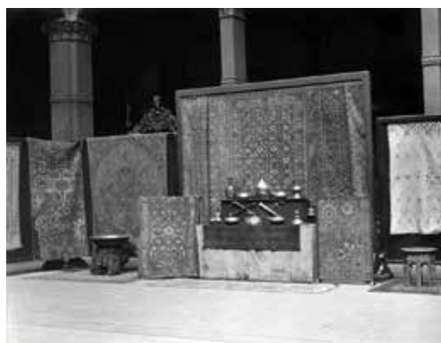
تصویر ۱۴: نمایشگاه هنر اسلامی، مونیخ، ۱۹۱۰.