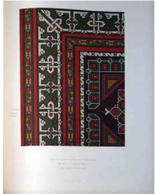
تصویر ۶ و ۷: برگ‌هایی از کتاب «فرش‌های شرقی در تابلوهای غربی سده‌های پانزدهم و شانزدهم میلادی» که لسینگ فرش نقاشی گرلاندایو Lessing, Julius. Altorientalische Teppichmuster: Nach Bildern und Originalen des XV. - XVI. Jahrhunderts gezeichnet von Lulius Lessing, E. Wasmuth, Berlin 1877