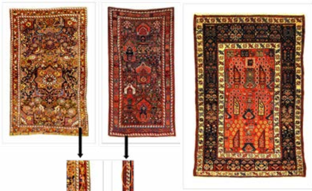
تصویر ۲ و ۳