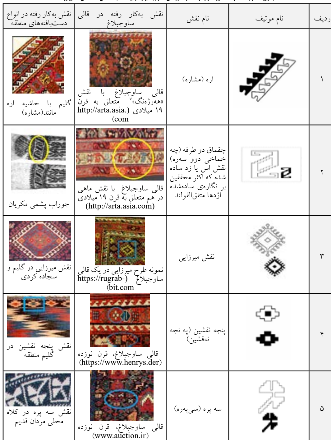
جدول ۱- وجه مشترک نقش تکرارشونده در قالی‌های ساوجبلاغ و انواع دست‌بافته‌های منطقه‌ی مکریان