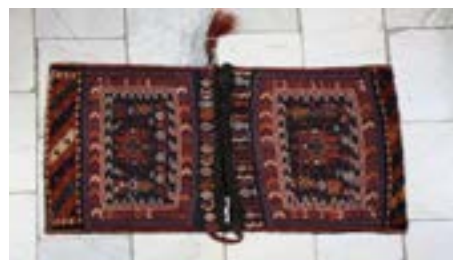
تصویر ۳- خورجین سوزنی با نقوش حیوانی لاک‌پشت و بز، بافت طایفه لر اولاد حاج علی