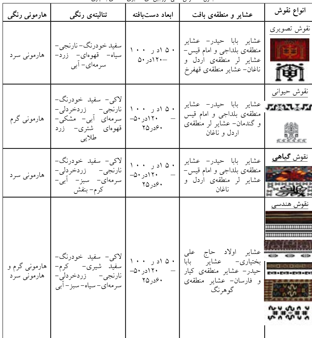
جدول ۱- نقوش ذهنی خورجین‌های عشایری منطقه‌ی بختیاری

این سازگاری به نوعی در دست‌بافته‌هایشان تأثیرگذار بوده است. نقوش ذهنی موجود بر روی دست‌بافته‌ها پس از شناسایی در چهار گروه دسته‌بندی شده و سعی شده تا حدی معانی مستتر و زیبایی‌های آن نقوش تبیین شود. این نقوش عبارتند از: نقوش هندسی، نقوش گیاهی، نقوش حیوانی، نقوش تصویری.