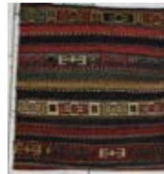
تصویر ۷- پشت خورجین سوزنی متوسط اولادی

این خورجین ریزباف نقشی راه راه و ریتمی زیبا را نشان می‌دهد. نکته‌ی قابل توجه در این خورجین، فشردگی بافت آن است که به تجربه‌ی شخصی وقتی داخل آن آب ریخته و پر شد، نشستی آب نداشت و همانند یک کوزه‌ی سفالی نم و رطوبت آب را به مرور پس می‌داد.