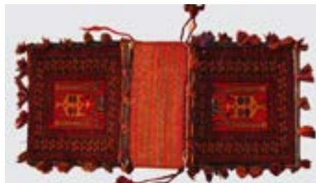
تصویر ۱- خورجین عشایری با نقش تصویری

نمایش پیکره‌ی انسان در دست‌بافته‌های بختیاری‌ها بسیار دیده شده و قابل تأمل است. این‌گونه خورجین‌ها با نقش تصویری که دارند، جزو ذهنی بافی‌ها و بداهه بافی‌ها محسوب می‌شوند و در واقع بافنده، با توجه به داستان‌ها و اتفاقات روزمره و سفرها و گفتمان‌های بین جمعیت طایفه‌ای خود؛ به تجسم آن نقش در ذهن خود دست یافته است. تصویر متعلق به یک خورجین تصویری عشایری است که با دو شیوه‌ی بافت، رویه شیوه‌ی فرش بافی پرزدار و زیره‌ی آن شیوه‌ی گلیم بافت ساده و شیرازه پیچی موی بز بافته شده است. نقش مرکزی بر زمینه‌ی لاک‌ی خورجین اصطلاحاً نقش گنبدی یا مسجدی است و در پایین دسته‌های نقش، پنجه‌ی دو دست قرینه را مشاهده می‌کنیم؛ که حضور این نقش پنجه‌ی دست، نشانه‌ای از اعتقادات مذهبی و تصورات ذهنی بافنده است. بر اساس تحقیقات میدانی و طبق گفته‌ی بافندگان و خبرگان محلی دریافتیم که استفاده از این‌گونه نقش‌ها و