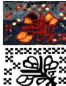
تصویر ۵- چنته‌ی کوچک عشایری بختیاری (چنته) با نقوش گیاهی (نگارندگان)

نقوش گیاهی اعم از انواع درخت و انواع گل و گیاه، به صورت ساده و استیلیزه شده در اکثر دست‌بافته‌های منطقه‌ی چهارمحال و بختیاری به‌وفور به کار برده شده است. در این تصویر یک چنته‌ی کوچک عشایری با تک نقشی خاص است که از سه شیوه‌ی بافت در آن استفاده شده است. رویه‌ی فرش‌بافی گرّه‌دار و لبه‌ی جیب‌ها جاجیم‌باف و پشت چنته گلیم بافت ساده است. به دلیل نقش بی‌قاعده ولی زیبا در این چنته، این چنته جزو بداهه‌بافی‌های پژوهش محسوب شده است. تنها یک درخت بزرگ با شاخ و برگ‌های گسترده و رنگ‌های نارنجی، سفید و لاک‌ی؛ کل کادر تصویر را پر کرده است. زمینه‌ی سرمه‌ای و آبی متن تصویر در کنتراست با زرد و قرمز