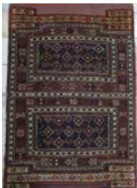
تصویر ۱۰- خورجین با نقش هندسی، محل بافت: روستای باباحیدر

نقوش هندسی یکی از رایج‌ترین و کهن‌ترین نقوشی هستند که از طبیعت گرفته شده و در فرش‌بافی و سایر دست‌بافته‌های منطقه‌ی چهارمحال و بختیاری به شکل‌های مختلف هندسی بسیار مورد استفاده قرار گرفته است. نقوش این تصویر همه هندسی بوده و در کمال نظم و اصول هندسه بافته شده‌اند، تا حدی که به نظر می‌رسد بافنده از علم هندسه و قرینه‌سازی‌ها آگاهی داشته است. قدمت این خورجین حداقل یک‌صد سال است که با ده سال حدس و گمان تخمین زده شده است.