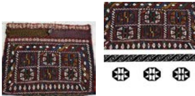
تصویر ۶- خورجین سوزنی متوسط اولادی با ساختاری ساده (نگارندگان) از مجموعه‌ی یوسف صمدی بهرامی

۱-۴- خورجین سوزنی متوسط اولادی با ساختاری ساده با نقش هندسی (تصویر ۶)