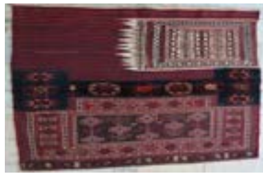
تصویر ۴- خورجین لری بختیاری (نگارندگان)

در خورجین‌های لری و خورجین‌های لرهای بختیاری، طرفین پرزبافی شده‌ی خورجین بالاتر و وسط خورجین تو رفته‌تر است. پالت رنگ‌آمیزی دست‌بافته‌های کوچک (مانند خورجین و خور) لرهای بختیاری تیره‌تر و کدرتر از پالت رنگ‌آمیزی دست‌بافته‌های کوچک (مانند خورجین و خور) لرهای ورامین است (تناولی، ۱۳۸۰). سه نوع تکنیک یا شیوه‌ی بافت در دست‌بافته‌های عشایر بختیاری از جمله در خورجین‌های بختیاری وجود دارد: