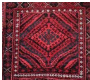
تصویر ۹- خورجین لری بختیاری با رویه یک تکه فرش‌بافی

جنس پشم و رنگ این خورجین آن‌چنان مرغوب و با کیفیت انتخاب شده است که تأثیر آن بر حرکت رنگ لاکه و رنگ آبی متن تصویر، موجب تشدید شفافیت رنگ و زنده بودن متن خورجین شده است؛ که در نوع خود بی‌نظیر و استثنایی است و هر چشمی را مجذوب خود می‌کند. رنگ سفید با تکرار دایره‌های ریز حاشیه‌ی کوچک (طره)، به شکل یک قاب مربعی هر لت (جیب) خورجین را در خود جای داده و باعث کمرنگ شدن حاشیه‌ی اصلی در خورجین شده است.