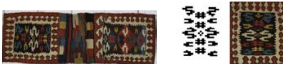
تصویر ۸- خورجین کوچک بداهه عشایری (نگارندگان)

حاشیه‌ی آن نقشی هندسی دارد و حرکت ریتمیک عنصر حاشیه نیز به بهترین صورت ترکیب هر جیب یا هر لت خورجین را کامل کرده است. رنگ سفید حاشیه در مقابل رنگ سیاه یا سرمه‌ای متن، کنتراست متعادلی را به وجود آورده است که دو نقش سفید ماریچی متن نیز ترکیب‌بندی تصویر را منسجم‌تر کرده و با نقوش آبی و زرد و قرمز متن سرمه‌ای که دارای همان حرکت ماریچی هستند؛ یک ریتم حرکتی استثنایی را خلق کرده است. تکنیک بافت رویه‌ی دو جیب و سطح میانی دو جیب این خورجین، گلیم بافت شبکه‌ای است (در بین سطوح بافته شده فضاهای خالی ایجاد شده که نور از آن‌ها عبور می‌کند)؛ که این نوع بافت خاص عشایر ایران است. تکنیک بافت خاص خورجین‌های بختیاری جفت قلاب است.