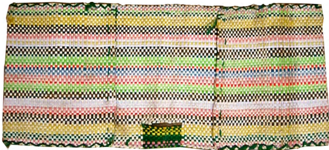
تصویر ۴: خورجین پشت دوچرخه، ابعاد: ۴۹ \times ۱۲۰ سانتی‌متر

رنگ‌بنلی و نقوش روی آنها با توجه به کاربرد متفاوت است. اگر برای جهیزیه عروس باشد رنگ‌های شاد و نقوش زیبا و بافت سوزنی برای آنها به کار گرفته می‌شود و به همین