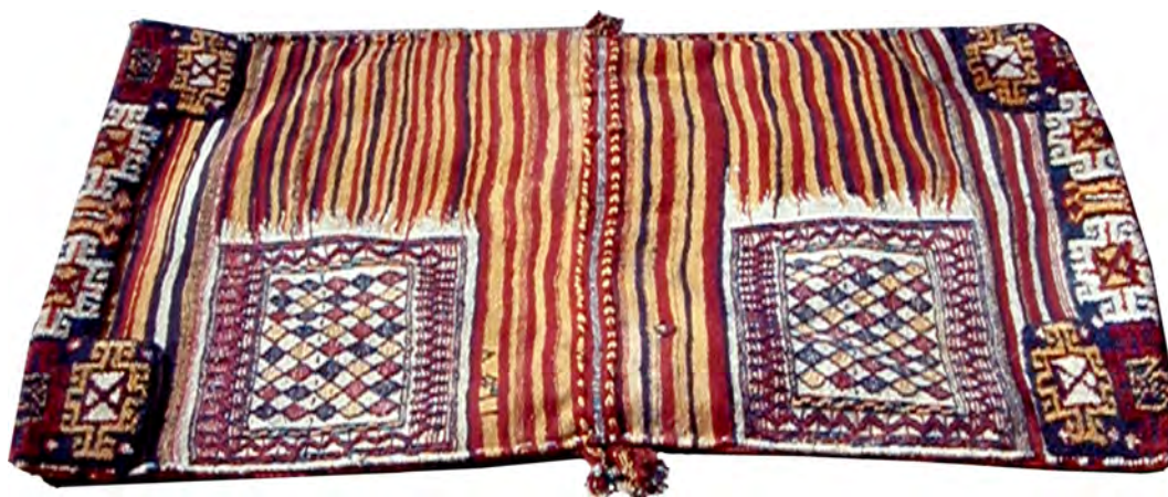
تصویر ۸ ب: پشت همان خورجین بزرگ (۸ الف)