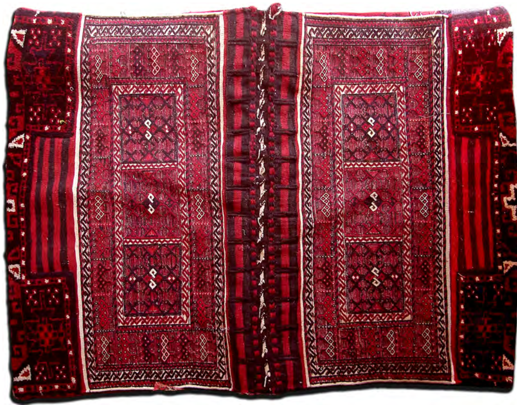
تصویر ۶: خورجین بزرگ، اندازه: ۱۱۳×۱۵۲ سانتی متر، بافت طایفه اولاد حاج علی

اهریمن تلقی می شده است.» (همان، ۱۳۴) (تصویر ۷). قسمت «۲» قالی باف است. استفاده از بافته پرزدار در خورجین، اول به خاطر خاصیت نقش اندازی زیاد آن که از بافت گره‌ای حاصل می شود و دوم به دلیل دوام و استحکام قالی است. به طوری که گفته شد تا خوردن این قسمت باعث ایجاد مخزن بار (جیب) خورجین می شود و چون این قسمت به هنگام حمل و نقل با زمین تماس دارد، بافت آن باید محکم تر باشد. قسمت «۳» رندی باف است و از داخل جیب خورجین دیده می شود و در پشت دست بافته قرار می گیرد. «دلیل این کار بنا به اظهارات اکثر زنان عشایر منطقه بافت، قرار گرفتن آن روی قلب حیوان می باشد و چون قلب مهم ترین عضو حیوان است، این نقش در جلوی لایه زیرین به کار می رود. قسمت «۴» در دو طرف نمای بیرونی و خارجی به صورت قرینه است و شیوه رندی بافی در آن به کار رفته و دور تا دور این طرح با قالی بافی محصور شده است.» (همان، ۱۳۶). زنان عشایر در بافت خورجین، با استفاده از رنگ های گیاهی و پشم دست ریس اقدام به بافت چنین محصولی می کنند. از خصوصیات بیشتر این خورجین ها استفاده از پشم هم برای چله و هم برای پود می باشد که به «پشم در پشم» معروف است. گاهی از موی بز در ترکیب با پشم