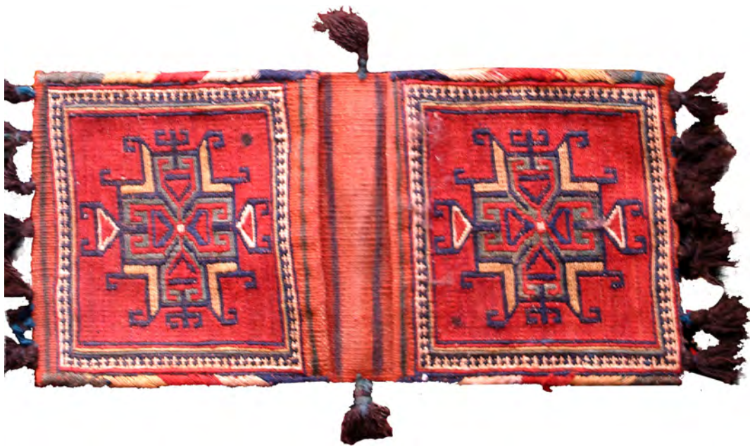
تصویر ۲: سرمدان، بافت طایفه اورکی