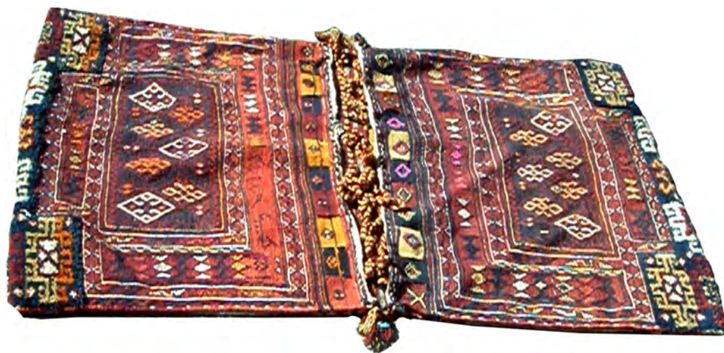
تصویر ۸ الف: روی یک خورجین بزرگ، ابعاد: ۱۰۰×۱۲۶ سانتی متر (مأخذ: نگارنده)

تاریکی هاست و به معنای نور امید و پیروزی اهورا بر اهریمن تلقی می شده است.» (سینایی، ۱۳۷۳، ۱۳۴). و به قول داریوش شایگان: «شاید حاکی از نفوذ مانویت باشد. می دانیم که تشعشع نور در نقاشی دیواری مانوی نقش مهمی داشته است؛ در این نقاشی است که هاله نورانی که بر گرد سر قدیسمین بسته می شود، نشانی است از گریزی به سوی عوالم غیب.» (شایگان، ۱۳۸۲، ۸۲). به نظر می رسد این نقش که یادآور آموزه های مانی است خود را سینه به سینه در قالب نقش تا زمان حال منتقل کرده است. اما در کل، نقوش به کار رفته در بافت خورجین ها را می توان این گونه تقسیم کرد: نقوش هندسی؛ نقوش طبیعی شامل: گیاه، حیوان، انسان و سایر مظاهر طبیعت نظیر: رود، کوه و...؛ و سومین دسته نیز نقوش برخاسته از عقاید و باورها و نقش اشیاء و فضای اطراف بافته شده است، چرا که «بازسازی فضا معادل است با تکیه بر اهمیت خیال که در اصل