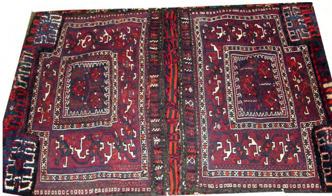
تصویر ۹: خورجین بزرگ، بافت شالو اولاد.

از مهم‌ترین مناطق تهیه این بافته می‌توان به دارجونه [۱۷]، چلگرد [۱۸]، کوهرنگ [۱۹] و مناطق مختلف بازفت اشاره نمود.» (کیبیری، ۱۳۸۶، ۸۴-۸۵). در اینجا جدولی حاوی نقوش ذکر شده در متن - که در بافت خورجین‌ها به‌طور مستقل یا در سایر گلیم‌باف‌ها مورد استفاده قرار می‌گیرند - ارائه می‌گردد.