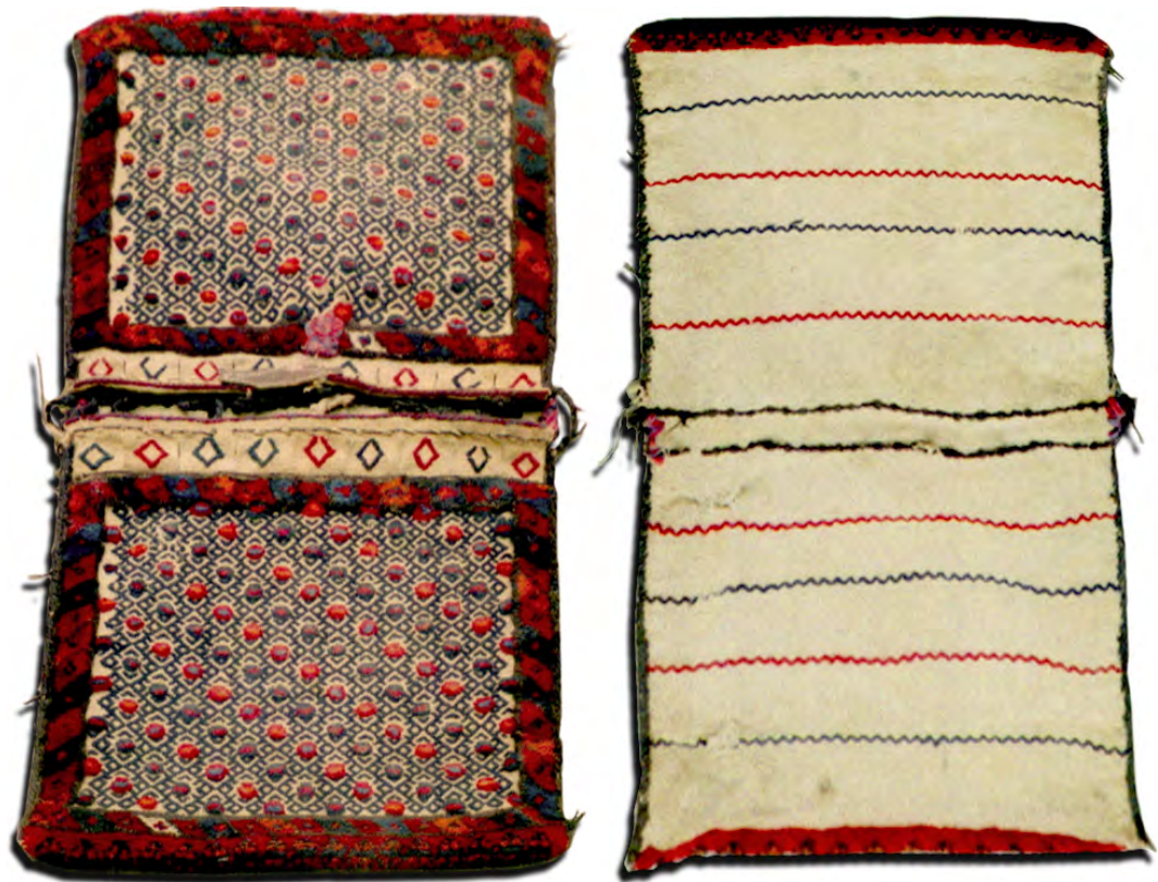
تصویر ۳: پشت و روی یک خورجین معمولی