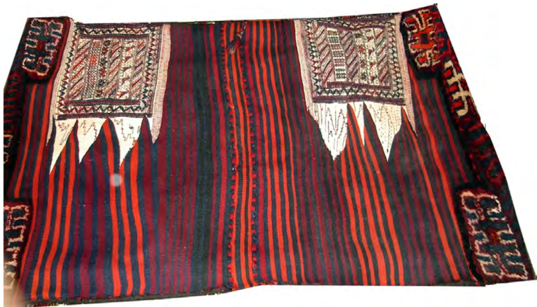
تصویر ۷: این نقش، حکایت از دمیدن نور امید از پس تاریکی‌ها دارد (مأخذ: نگارنده)

در خورجین‌های بزرگ، نقوش در قسمت‌های پرزدار با قسمت‌های بدون پرز متفاوت است. مهم‌ترین نقشی که دارای بار معنایی است و در پشت کار بافته می‌شود عبارت است از مربع‌هایی که نقوشی مثلثی شکل از آن وارد نقش راه‌راه سورمه‌ای و قرمز رنگ زمینه می‌شوند. «بر اساس تعبیر بافندگان، به‌کارگیری رنگ سفید به‌صورت شعاع یا پرتو از لابه‌لای خطوط افقی و موازی سیاه و سرمه‌ای و قرمز، نشانه تابیدن نور از پشت