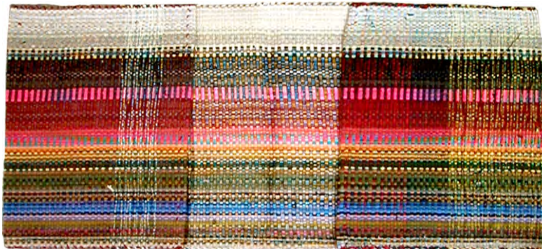
تصویر ۵: خورجین روی شانه، ابعاد: ۴۷×۱۰۳ سانتی‌متر