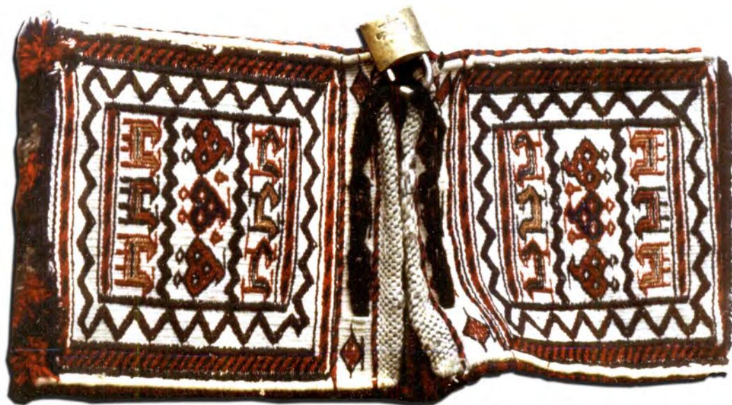
تصویر ۱: اکبه‌خورجین، اندازه: ۶۰×۲۵ سانتی‌متر

نوع اول که از لحاظ اندازه کوچک هستند به «اکبه» [۱۰] خورجین» معروفند و بیشتر برای نگهداری اسناد، اشیای قیمتی، وسایل شخصی یا زیورآلات به‌کار می‌روند که برخی از آنها مخصوص بانوان به‌ویژه هنگام سوارکاری است و آن را معمولاً جلوی زین اسب آویزان می‌کردند تا سوارکار بتواند وسایلش را نیز درون آن بگذارد. معمولاً آن‌دسته از خورجین‌ها که جلوی حیوانات