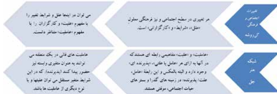
تصویر شماره ۱. مدل نظری پژوهش

مسئله مورد مطالعه در این پژوهش، با توجه به اهداف در نظر گرفته‌شده برای آن، رویکردی «میان‌رشته‌ای» را طلب می‌کند. یکی از اهداف مطالعات میان‌رشته‌ای در حوزه علوم انسانی مشاهده پدیده‌ها، مکمل‌سازی، تداخل، ترکیب