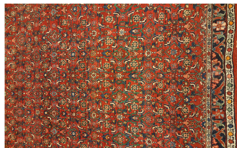
تصویر ۳- طرح ماهی بیجار و درخت زندگی

واقع چگونگی ارتباط بین این عناصر باهم نمادی از حیات است که به هزاره‌های پیش از میلاد می‌رسد. (تصویر شماره ۳).