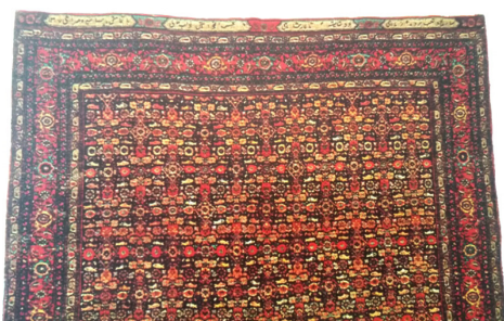
تصویر ۱۰- قالی بندی ماهی درهم بافت بیجار ۱۳۰۷ ه.ق، موزه فرش ایران ( https://www.mattcamron.com / rug-education/bijjar )

طرح قالی بندی ماهی درهم، شناسه، [بسی رنج و تعب برده زماهی ... بود شایسته تالار شاهی]، نوع خط، نستعلیق، بافت بیجار ۱۸۸۹م/۱۳۰۷ق، موزهی فرش ایران. (تصویر شماره ۱۰).