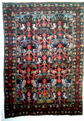
تصویر ۲- تصویر جانوری و انسانی (Oriental Rug Review)

طرح ماهی زبیده و ماهی حسن آباد یکی است که به ماهی درشت معروف است. ماهی میرک کوتاه و پهن است و شلوغ‌ترین طرح ماهی می‌باشد و نام طرح ماهی گوهر چین در بیجار ماهی بی ارزش است)، طرح‌های هندسی (مانند سمن بر خانم، اسلیمی شکسته، خاتم شیرازی، نقشه هراتی) با ترنج وسط و ... است. (تصویر شماره ۱).