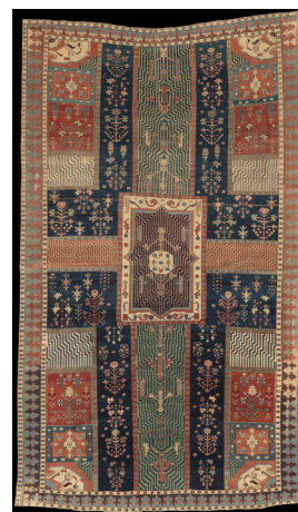
تصویر ۶- فرش چهار باغی قرن ۱۸ موزه متروپولیتن (پرهام، ۱۳۷۱: ۱۳۴)

نقشه‌ی قالی بهارستان خسرو پرویز است (پوپ و آکرمن، ۱۳۸۷: ۱۲۷۰) (تصویر شماره ۸)