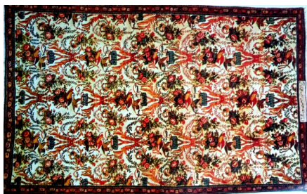
تصویر ۹- قالی بندی گل فرنگ، بافت بیجار ۱۳۰۱ ه.ق، موزهی فرش ایران (حشمتی رضوی، ۱۳۸۷: ۲۷۰)

طرح قالی بندی گل فرنگ، شناسه، [فرمایش سرکار علیرضاخان سرتیپ عمل گروس (گروسی)]، نوع خط نستعلیق، محل بافت بیجار، گروس، تاریخ بافت ۱۸۸۳م/ ۱۳۰۱ ق، موزهی فرش ایران. (تصویر شماره ۹).