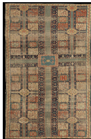
تصویر ۸- قالی چهارباغ موزهی کویت (پوپ و آکرمن، ۱۳۸۷: ۱۲۷۰)

طرح قالی بندی گل فرنگ، شناسه، [فرمایش سرکار علیرضاخان سرتیپ عمل گروس (گروسی)]، نوع خط نستعلیق، محل بافت بیجار، گروس، تاریخ بافت ۱۸۸۳م/ ۱۳۰۱ ق، موزهی فرش ایران. (تصویر شماره ۹).