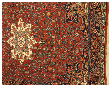
تصویر ۱- ترنج و لچک و ماهی بافت بیجار (مجموعه‌ی شخصی)