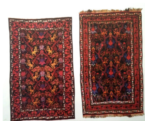
تصویر ۵- تصویر جانوری شیر (Oriental Rug Review)

«در اغلب موارد شیر نماد شوکت و جلال سلطنت و قدرت و عظمت پادشاهان بوده است. نبرد شیر با گاو شاید معرف اسطوره‌ی کهن نبرد مهر با گاو و دریدن آن و آوردن برکت باشد. که در اساطیر مهری وجود دارد و در نقوش بازمانده از آیین میترا بارها به ارتباط شیر با سر بریده‌ی گاو بر می‌خوریم. محتمل است که شیر در آیین میترا، مظهر زمینی مهر و خورشید در میان درندگان باشد که در دین زرتشتی در دوران‌های بعد این نبرد به اهریمن داده شد» (حصوری، ۱۳۷۵: ۱۴-۱۵). (تصویر شماره ۵).