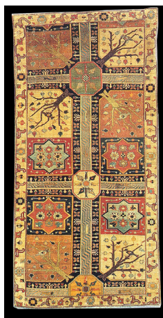
تصویر ۷- قالی بزرگ گلستان قرن ۱۹ موزه متروپولیتن (خوانساری، ۱۳۸۳: ۵۱)

۳- قالی بزرگ گلستان قرن نوزدهم، موزه متروپولیتن، قالی که با بهار خسروانی در دوره‌ی ساسانی مطابقت دارد و در قرن ۱۷ در غرب بافته شده است که دارای تشابهات فراوان با نقشه‌ی چهارباغ بیجار دارد. کهن‌ترین نمونه‌ی قالی متعلق به کردستان (بیجار و ...)، فرشی است که دارای طرحی با نقشه و طرح گلستان است. (تصویر شماره ۷).