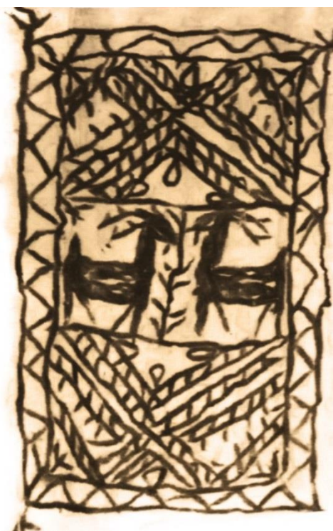
تصویر ۱۳. نمد کرند غرب، با نقش جفت‌شکار و درخت زندگی (مأخذ: جزمی، ۱۳۶۳، ۷۰)

حاشیه این نمد نیز از دو قسمت تشکیل شده است. قسمت اول با تکرار نقش «هفت و هشت» ایجاد شده که نمادی از آب است و قسمت دوم با تکرار نقش «توک مامر» ۲۴ که به حالتی زنجیره‌وار به هم متصل شده‌اند. این تصویر برگرفته از کتاب هنرهای بومی در صنایع دستی باختران بوده که در آن نقش وسط را «سینی» معرفی کرده است و در