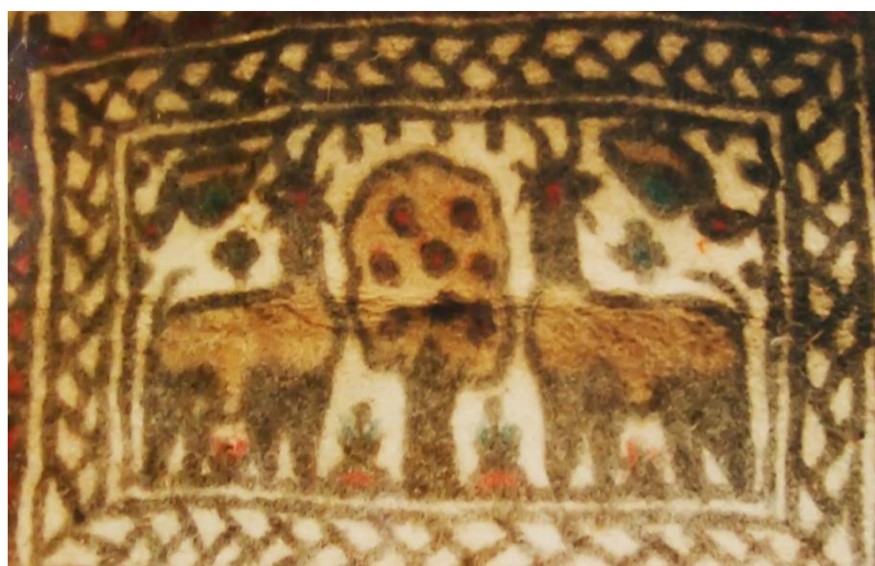
تصویر ۱۰. نمذ شهر کرمانشاه با نقش جفت شکار و درخت زندگی (مأخذ: پیرهوشیاران، ۱۳۷۲، ۳۹)