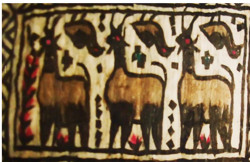
تصویر ۷. نماد شهر کرمانشاه با نقش سه شکار و مرغ

است. سر دو تا از بزها به سمت جلو، ولی سر بز اول به سمت عقب ترسیم شده است و دید مخاطب را به جای خروج از کادر دوباره به بزها معطوف می‌کند و به این ترتیب گردش بصری را در کادر نماد سبب می‌شود. همچنین نقش حاشیه نماد در این تصویر از نوع گل گندمی است.