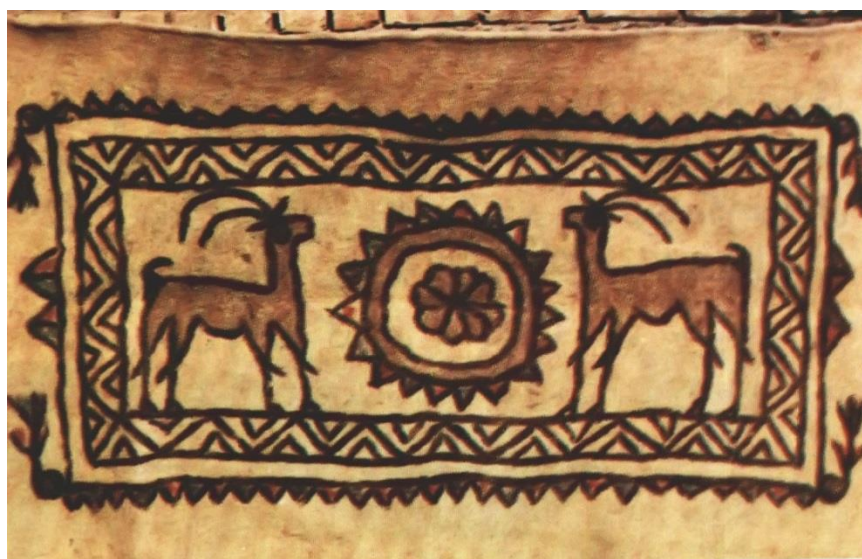
تصویر ۱۴. نماد اسلام‌آباد غرب، با نقش جفت‌شکار و برکه آب

تمام تحقیقات و پایان‌نامه‌های بعدی نیز که به آن استناد شده، این اشتباه تکرار شده است. در حالی که با توجه به نقش‌مایه نیلوفر آبی که در وسط آن ترسیم شده، احتمالاً نقش میانی حوض یا برکه آبی بوده است. همچنین «بز» با «برکه آب» رابطه بیشتری می‌تواند داشته باشد تا نقش‌مایه سینی. این نکته زمانی روشن‌تر خواهد شد که بدانیم در شهر