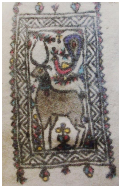
تصویر ۲. نمدها شهر کرمانشاه با نقش شکار و پرنده

مرغابی است. در نمدهای استان کرمانشاه به ندرت تصویر مرغابی را بر پشت بز می‌بینیم و معمولاً جهت تزئین و در حاشیه طرح نمدها به کار می‌رود. البته در این تصویر، طرح چهار مرغابی دیگر را در چهار گوشه کادر نمدها مشاهده می‌کنیم.