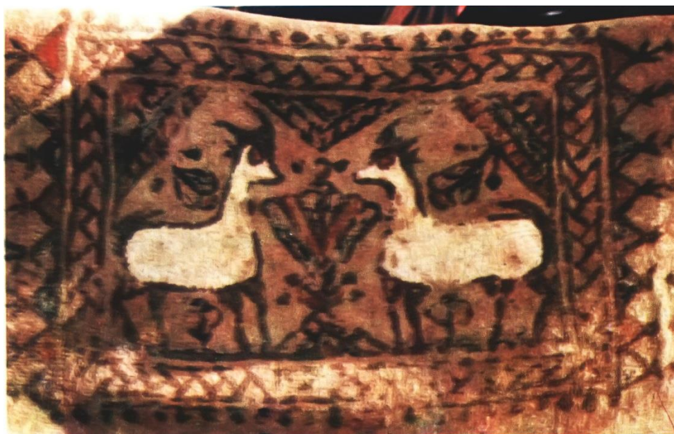
تصویر ۱۲. نماد گیلانغرب با نقش جفت‌شکار و درخت زندگی

یکی دیگر از مناطق استان کرمانشاه که در گذشته دارای حرفه نمدمالی بوده ولی امروزه اثری از این هنر و کارگاه‌های آن در سطح منطقه دیده نمی‌شود، شهرستان گیلانغرب بوده است. تصویر ۱۲ یکی از نقش‌اندازی‌های نمدمالی این منطقه با نقش جفت‌شکار و درخت زندگی را نشان می‌دهد. دو بز سفید با شاخ‌هایی کوتاه و پاهای سیاه، در دو طرف