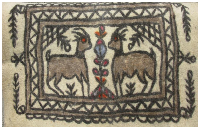
تصویر ۱۱. نمذ شهر کرمانشاه با نقش جفت شکار و درخت زندگی، کارگاه مشی آمان

در تصویر ۱۱ نیز نوع دیگری از نقش‌اندازی موسوم به جفت شکار و درخت زندگی را مشاهده می‌کنیم که در کارگاه‌های شهر کرمانشاه تولید می‌شود. تصویر دو بز با پشتی صاف، شاخ کوتاه، شکمی آویزان و پاهایی باریک که روبه‌روی هم