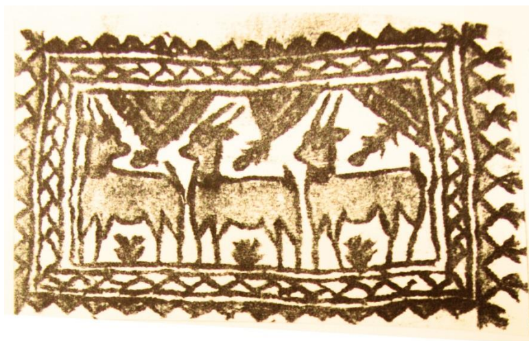
تصویر ۸. نماد شهر کرمانشاه با نقش سه شکار، کارگاه مشی آمان (مأخذ: همتی وینه، ۱۳۷۵، ۹۰)