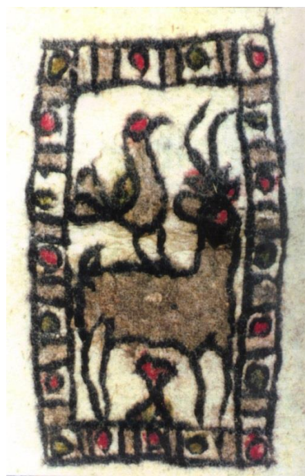
تصویر ۴. نماد اسلام‌آباد غرب با نقش تک‌شکار و کبوتر

به زاویه قائمه ترسیم شده است. لازم به توضیح است که طرح حاشیه در این نماد به صورت هفتی-هشتی نبوده و از این منظر با سایر نمدهای شهر کرمانشاه متفاوت است. این حاشیه در نمدهای دیگر مناطق استان دیده نمی‌شود و فقط به نمدهای اسلام‌آباد غرب اختصاص دارد.