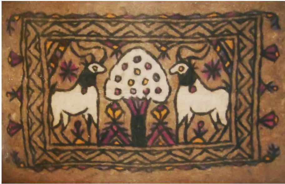
تصویر ۹. نمذ شهر کرمانشاه با نقش جفت شکار و درخت زندگی

دیگر اینکه در نقوش حاشیه، خطوط شکسته متفاوت طراحی شده‌اند و نقش‌های بیرونی حاشیه متفاوت‌تر، برجسته‌تر و مشخص‌تر دیده می‌شوند. تفاوت دیگری که نقش بز در این تصویر با نمونه قبلی دارد این است که سر بزها به سمت عقب برگشته و نگاه بزها به مرکز نیست، بلکه به طرفین و به سوی حاشیه نمذ است. در این نقش، سرها کوچک، پاها بسیار پهن‌تر از حد معمول و دم به صورت نوار باریکی که به طرف بالا برگشته، تصویر شده‌اند. روی ریش و دم بز نیز تأکید شده است. بدن بزها همانند مستطیلی کشیده و پاها به صورت مثلث‌هایی که رأس آنها به طرف پایین است به تنه وصل شده‌اند.