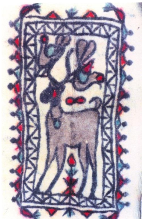
تصویر ۵. نماد اسلام‌آباد غرب با نقش تک‌شکار و کبوتر (مأخذ: همتی وینه، ۱۳۷۵، ۷۹)