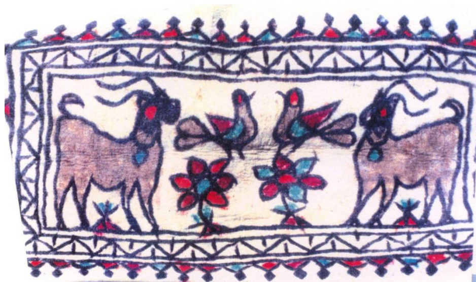
تصویر ۶. نماد اسلام‌آباد غرب با نقش جفت‌شکار و کبوتر