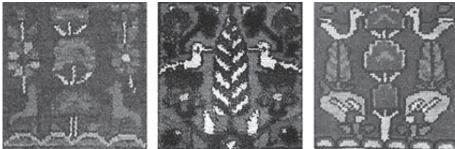
تصویر ۶: نمونه‌هایی از تصویر مرغ و درخت در فرش خشتی (نقش مایه پرنده در دو سوی درخت)