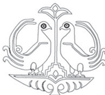
تصویر ۵: سمت راست: نگاره ساسانی؛ سمت چپ: نقش مایه پارچه ابریشمی بافته شده در ری، سده ۶ یا ۷ ه.ق.