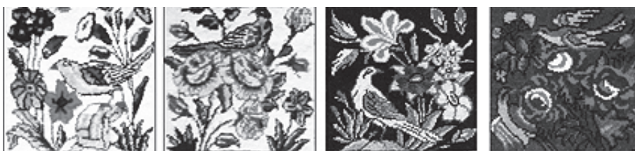
تصویر ۹: نمونه‌هایی از تصویر گل و بلبل در فرش خشتی