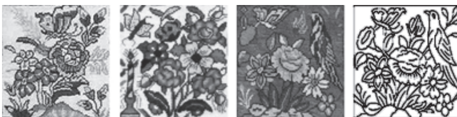
تصویر ۱۰: نمونه‌هایی از تصویر پروانه در فرش خشتی