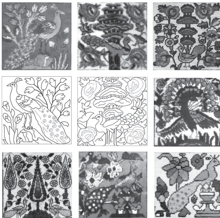
تصویر ۴: نمونه‌هایی از نقش مایه طاووس در فرش خشتی