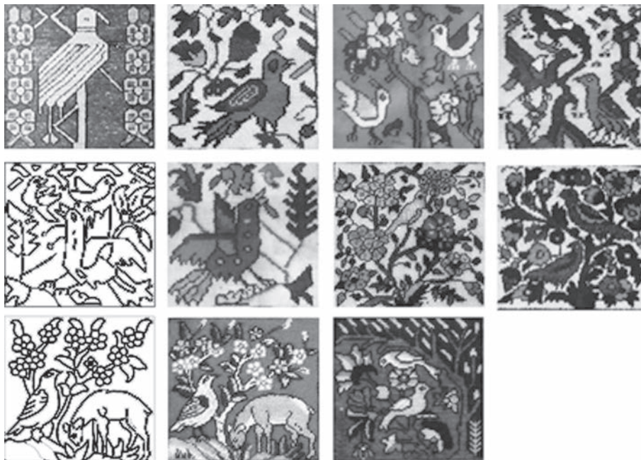
تصویر ۲: نمونه‌هایی از نقش مایه پرنده در فرش خشتی

مکان خاصی برای نگهداری طاووس اختصاص داده شده بود (خزایی، ۱۳۸۶، ۸). در بسیاری از آثار دوره ساسانی نقش طاووس در تزیینات قرار گرفته است. در ایران پس از اسلام به‌عنوان نمادی از مرغ آفتاب و باروری کیهانی و ذاتی شناخته شده است. تعدادی از عرفا و شاعران دوران اسلامی هر کدام به‌نوبه خود در تحسین و یا تقبیح طاووس اشعاری سروده‌اند که هر کدام جای تأمل و تفکر دارند. کارکرد نمادین این نقش در معماری پس از اسلام، در مدارس دینی، مساجد و اماکن مذهبی و حتی منازل شخصی افراد به‌وفور یافت می‌شود. نقش طاووس در تزیینات سردر ورودی بسیاری از مکان‌های مذهبی از جمله مسجد امام اصفهان، حرم امام رضا (ع) و مقبره خواجه ربیع مشهد وجود دارد. طبق نظر عامه، نقش طاووس بر فراز در ورودی مساجد، همزمان شیطان را دفع و مؤمنین را استقبال می‌کند (خزایی، ۱۳۸۲، ۱۴۱). در ادبیات ایران ترکیباتی چون: طاووس آبگین خضرا (کنایه از آسمان)، طاووس آتش‌پر (کنایه از آفتاب)، طاووس فلک