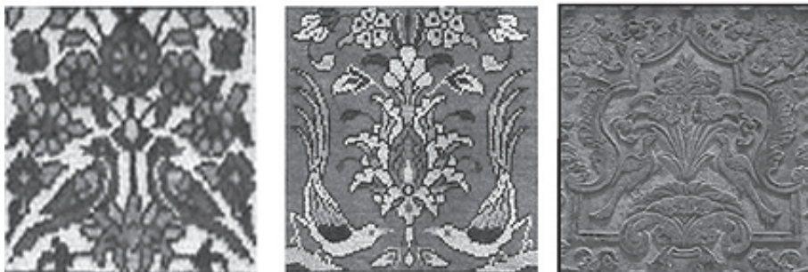
تصویر ۷: نمونه‌هایی از تصویر مرغ و درخت در فرش خشتی (نقش مایه پرنده در دو سوی گیاه، خشت فرشته)، گوشه پایین سمت راست: نمونه‌ای از این نقش بر حجاری منطقه