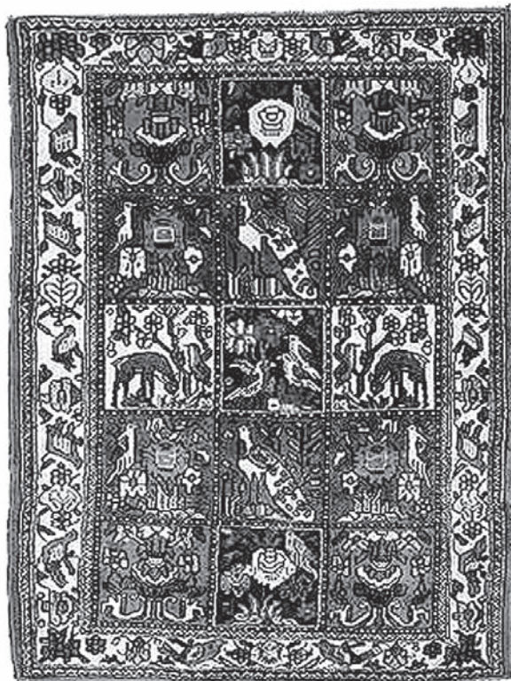
تصویر ۱: فرش‌های خشتی با نقش‌مایه پرنده

علاوه بر مفاهیم کلی اطلاق شده به پرنده، هر یک از پرندگان مفاهیم متفاوتی دارند. در حالیکه پرندگانی مانند جغد و کلاغ بر بدشگونی دلالت دارند، کبوتر و بلبل نمادی از خوش‌یمنی هستند. پرندگانی که نماد فعالیت بیشتر عقلانی اند تا عاطفی، سیه‌فام‌اند. و اما پرندگان فضای زندگانی عاطفی پرواز می‌کنند. پرنده سفید نماد روح افراد پارسا و پرنده سیاه نماد روح شریر است (جایز، ۱۳۷۰، ۲۹).