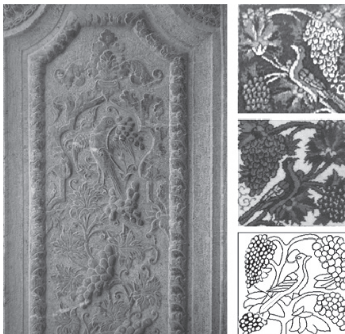
تصویر ۳: سمت راست: نمونه‌هایی از نقش‌مایه پرنده و درخت‌انگور در فرش خشتی؛ سمت چپ: درخت‌انگور و پرنده در حجاری معماری منطقه (قلعه چالستر)

است که نشان از علاقه بافندگان منطقه به این نقش دارد. این نقش در فرش‌های خشتی همچون فرش‌های سرو و کاج در بیشتر موارد با نقش درخت به‌خصوص درخت کاج همراه است. به این ترتیب که نقش طاووس در مقابل و پای درخت کاج قرار می‌گیرد (تصویر ۳).