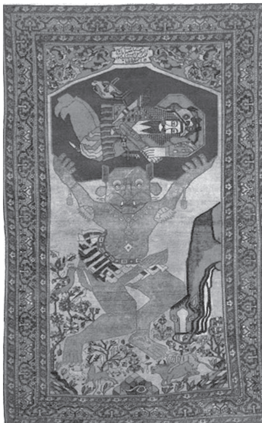
تصویر ۱: قالیچه تصویری ساروق، ابعاد ۱۳۲×۲۰۳ سانتی‌متر، اواخر قرن ۱۳ ه.ق. (مأخذ: صوراسرافیل، ۱۳۷۲)