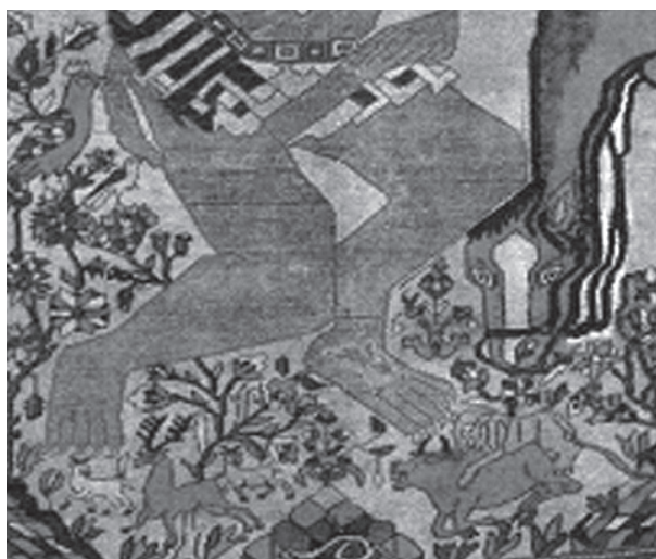
تصویر ۴: جزئی از تصویر ۱، سبزه‌زار به همراه رخس، نقش گرفت‌وگیر، گوزن و پرند