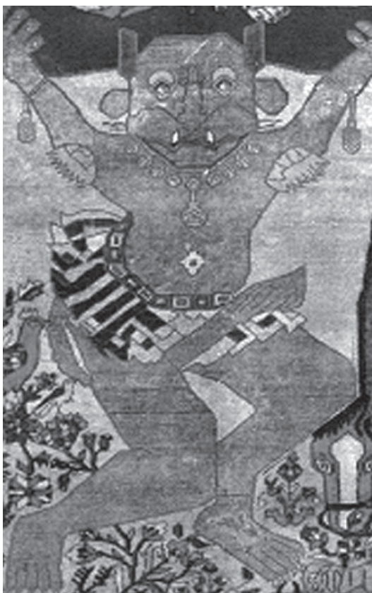
تصویر ۳: جزئی از تصویر ۱، اکوان دیو در حالی که رستم را بالا برده است.