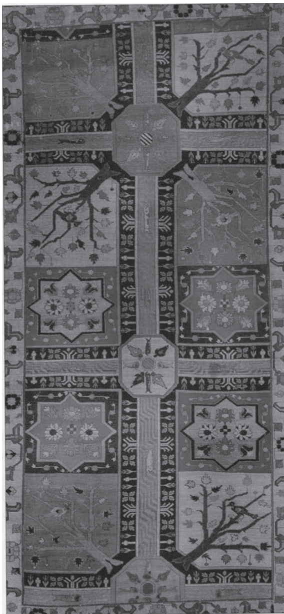
▲ تصویر ۳

تصویر ۳: فرش با طرح باغی، قرن ۱۱ هجری، احتمالاً کرمان (خوانساری، ۱۳۸۳: ۱۵۵)