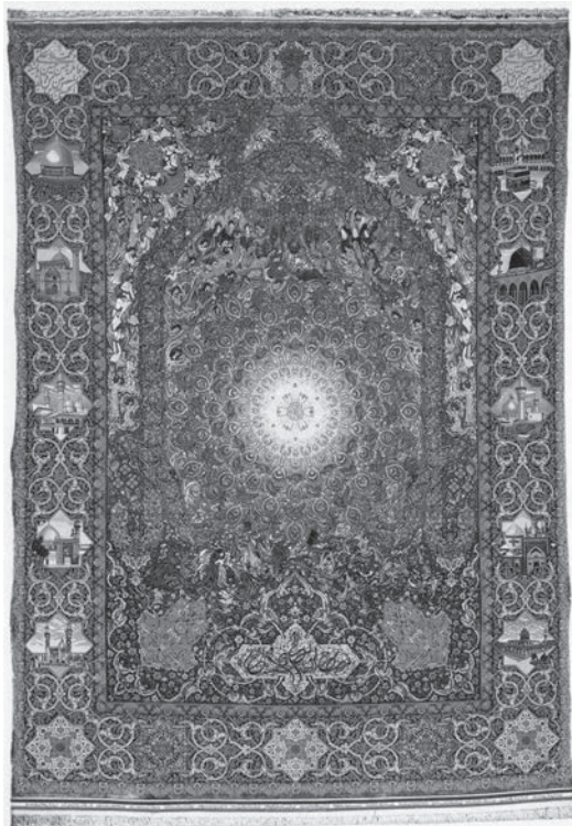
تصویر ۶: فرش ثارالله، بافت اصفهان، سال ۱۳۶۶ هـ.ش، ابعاد ۵۰۵×۲۶۵ سانتی‌متر (بصام و همکاران، ۱۳۸۳: ۱۰۵)

نمادها به رغم آنکه ارزش‌های‌شان مدام تغییر یافته است ولی معانی جدیدی کسب کرده‌اند و به نظام‌های فکری بیش از پیش پیچیده‌ای پیوسته‌اند. معهداً وحدت ساختاری‌شان به گونه‌ای دست‌نخورده و محفوظ مانده است. مردم در فرهنگ‌های گوناگون، نظریات مرکز جهان، محور عالم، ارتباط میان مراتب کیهانی، گسست در عرصه هستی (ارتقاء از مرتبه‌ای به مرتبه‌ای دیگر) و غیره را کاملاً تجربه کرده و زیسته‌اند و برای آن اندیشه‌ها به گونه‌های مختلف ارزش قائل بوده‌اند. اما این تغییرات ضوابط و نظام‌های هنری وحدت ساختاری این رده از نمادها را به مخاطره نمی‌اندازند و حتی جاودانگی‌شان مسئله‌ای است که مورخ ادیان موظف به گشودنش نیست، چون در واقع پرسش این است که آیا این نمادها بیانگر تجربه وجودی اساسی‌ای و خاصه موقعیت ویژه انسان در کیهان نیستند؟ مبنای همه این نمادها تصور ناهماهنگی فضا است که در همه مراتب فرهنگ به چشم می‌خورد و با تجربه‌ای اصلی یعنی تجربه قداست تطبیق می‌کند. در جوار فضای گیتیانه و در تضاد با آن، فضای قدسی وجود دارد که در آن به مرتبه متفاوتی از وجود پا می‌نهییم و با آنچه ماوراء انسان است ارتباط می‌یابیم (الیاده، ۱۳۸۷: ۲۰۲-۲۰۳).