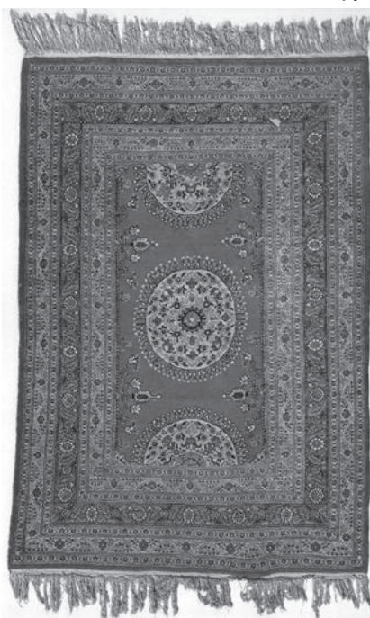
▲ تصویر ۵