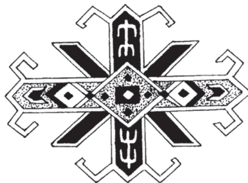
شکل ۱: چمچه ترکمن (مأخذ: حصوری، ۱۳۷۱: ۱۷۸)