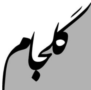
فرم اشتراک فصلنامه علمی پژوهشی گلجام

لطفاً فرم اشتراک تکمیل شده را به همراه اصل فیش بانکی شماره حساب جاری ۶۶۶۴/۶ بانک ملت شعبه چهارراه جمالزاده (کد ۶۷۳۵۵) در وجه انجمن علمی فرش ایران واریز و به نشانی: تهران، خیابان سپهبد قرنی، نرسیده به پل کریمخان زند، خیابان شهید کلاتری، پلاک ۶۴، ساختمان شرکت سهامی فرش ایران، طبقه هفتم یا تهران، صندوق پستی ۱۳۶۱-۱۳۱۴۵ ارسال نمایند. تلفن: ۸۸۹۲۹۳۵۷-۸۸۹۲۹۳۵۸