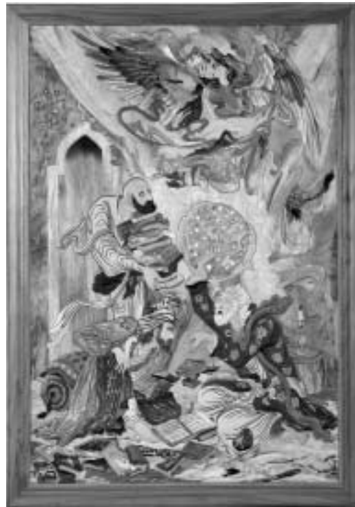
تصویر ۲ - تابلو معرکة مینت