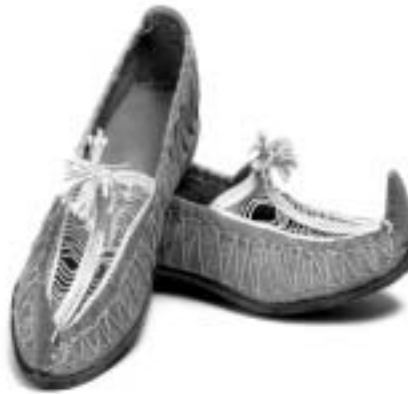
تصویر ۱۵ - کفش چرمی زنجان