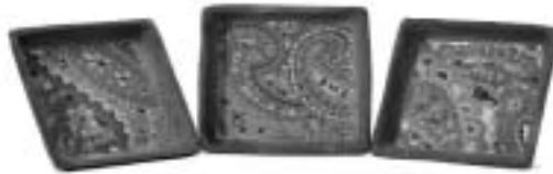
تصویر ۱۳ - سرامیک تهران