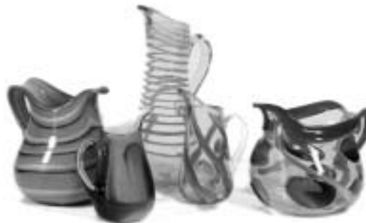
تصویر ۱۷ - شیشه تهران