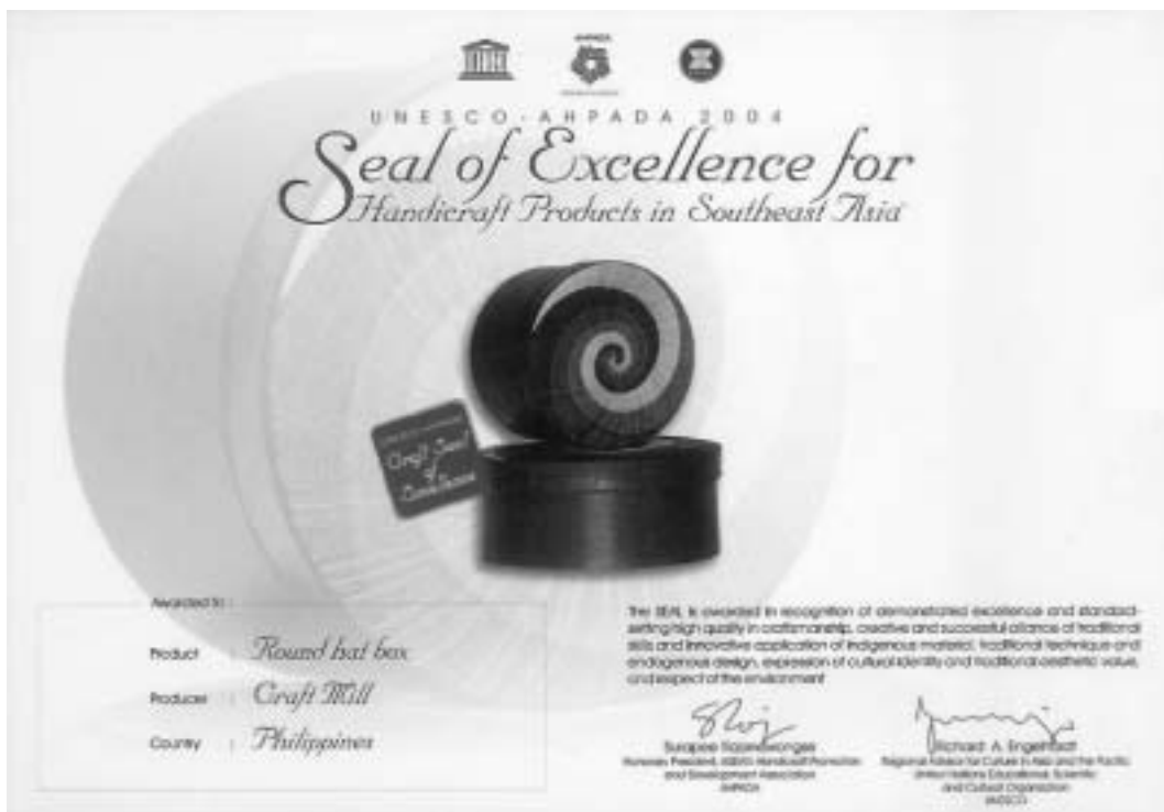
تصویر ۱ - نمونه مهر اصالت

مهر اصالت، گواهینامه‌ای است که یونسکو و دفترهای فرهنگی - هنری منطقه‌ای مشترکاً برای حفظ، احیا و تداوم فعالیت حرفه‌ای و ارزشهای بومی و سنتی، به صنایع دستی اصیلی اعطا می‌کند که هنرمندان و صنعتگران با مهارت‌های حرفه‌ای، الگوها و مفاهیم سنتی را ابداع و نوآوری نمایند.