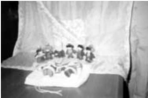
تصویر ۲۱ - عروسکهای نمادی