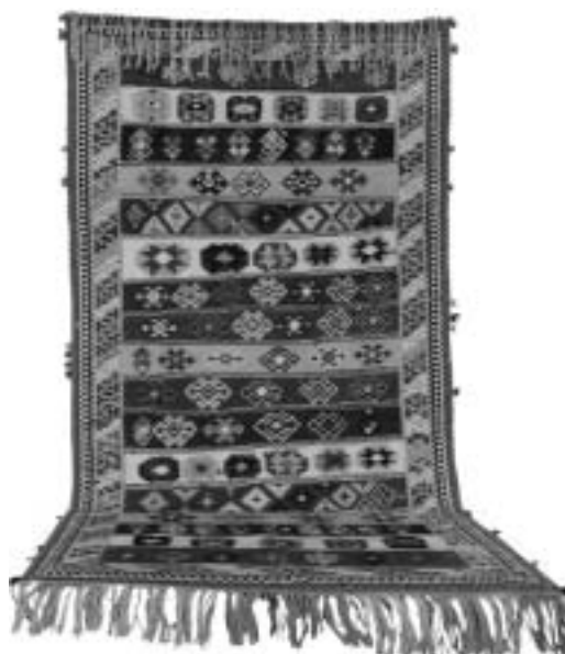
تصویر ۶، گلیم قشقایی فارس