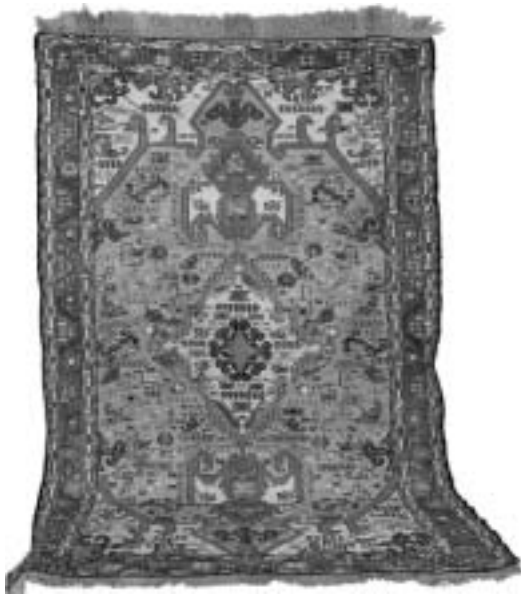
تصویر ۳، گلیم ورنی آذربایجان شرقی