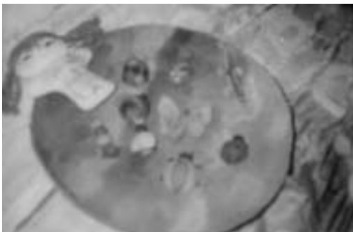
تصویر ۲۲ - اشکال نمادین