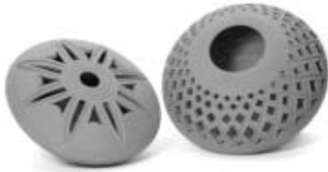
تصویر ۱۴ - سرامیک مازندران