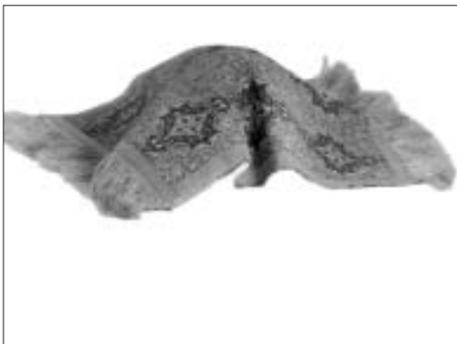
تصویر ۱۱- زری بافی اصفهان، مأخذ: آرشیو سازمان صنایع دستی ایران