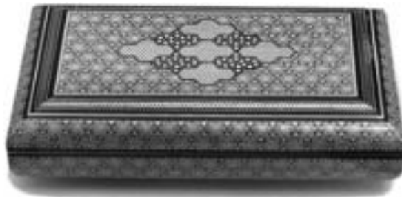
تصویر ۴، جعبه خاتم فارس