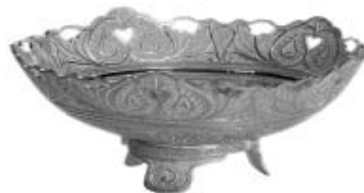
تصویر ۸، ظرف ملیله نقره کاری زنجان