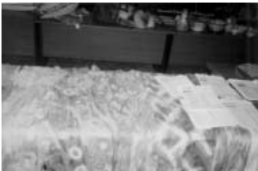
تصویر ۲۰ - روسری های تلفیقی