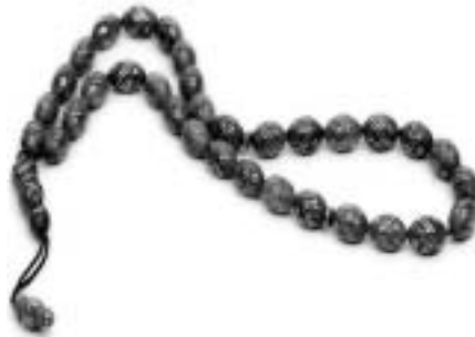
تصویر ۵، تسبیح چوبی نقره کوب آذربایجان شرقی