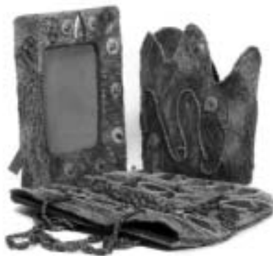
تصویر ۱۸ - الیاف طبیعی بوم (لیف درخت خرما)