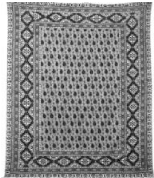
تصویر ۷، رومیزی قلمکار اصفهان