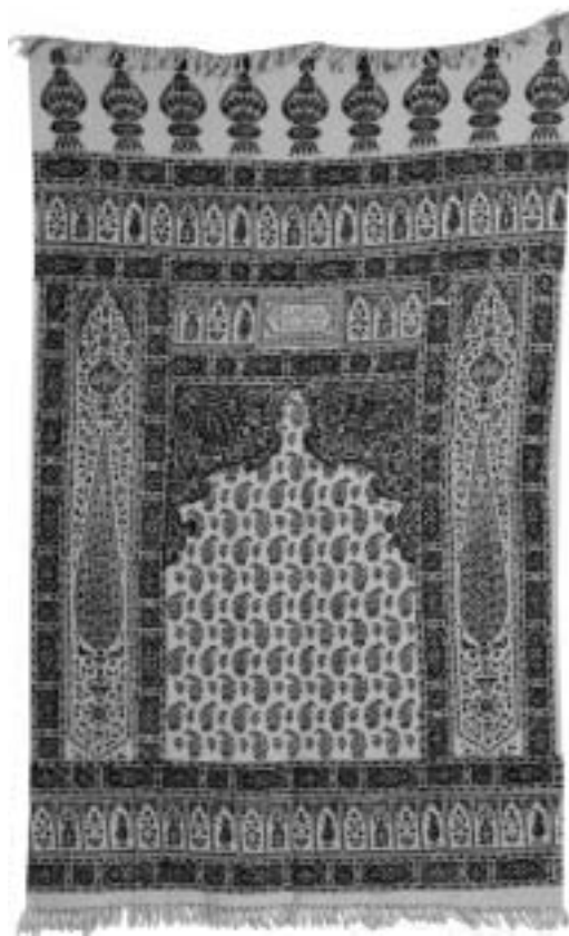
تصویر ۱۲، قلمکار اصفهان

به اقلامی که به میانگین عدد سه نایل شوند ولی در یک ردیف از یک ورقه ارزیابی نمره صفر یا یک کسب کنند یا معدل کلی آنها کمتر از سه باشد، مهراصالت تعلق نمی‌گیرد و ضمن تعیین و انعکاس ایرادات موردنظر، از متقاضی می‌خواهند که پس از اصلاح مورد یا موارد مزبور ۱۷ ، مجدداً اثر را برای داوری سال بعد ارائه نماید.