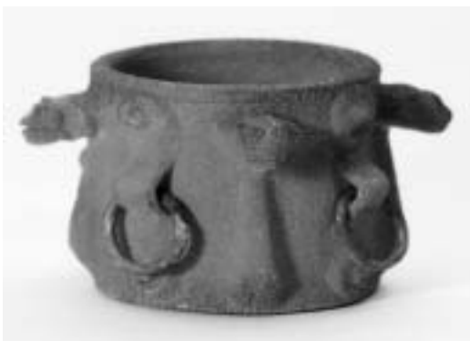
تصویر ۹- سفال سمنان