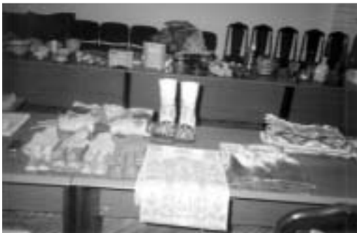
تصویر ۱۹ - اشیاء سفالی و پوتین

از طرف دیگر، اقلام کوچک و ارزان قیمتی چون روسری و شال ابریشمی و نمدی با رنگبندی و طراحی و تلفیق جالب، عروسکهای نمادین برخی کشورها، جواهر آلات بدلی و سفالینه‌هایی که با رعایت ابداع و نوآوری و قابلیت ارائه به بازارهای خارجی، در نهایت سادگی و ملحوظ داشتن جنبه کاربردی مشخص، ساخته و پرداخته و ارائه شده بودند، به راحتی مهراسالت دریافت کردند. بنابراین می توان گفت قیمت و کیفیت بالا، شکل یا اصیل بودن اثر به تنهایی ملاک موفقیت نیست و به جنبه‌هایی چون رقابت پذیری، بازار داری و کاربری مصنوع نیز باید توجه کرد.