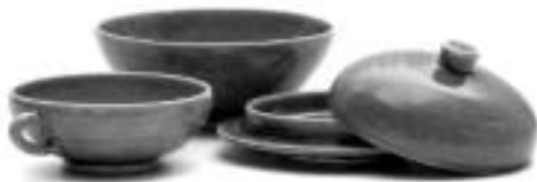
تصویر ۱۶ - سرامیک تبریز