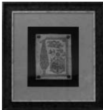
تصویر ۱۰- تابلو قلم زنی اراک، مأخذ: آرشیو سازمان صنایع دستی ایران