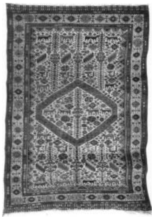
تصویر ۵: قالی قشقایی، تیره شکرلو

در قلمرو بحث مذکور، متن ۱۳ ، حاشیه ۱۴ و ساختار کلی