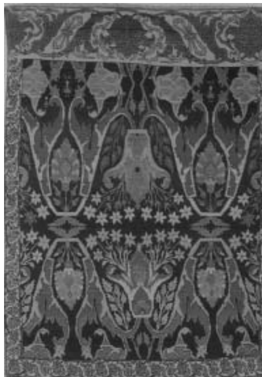
تصویر ۳: اورنگ از منطقه روستای بیجار