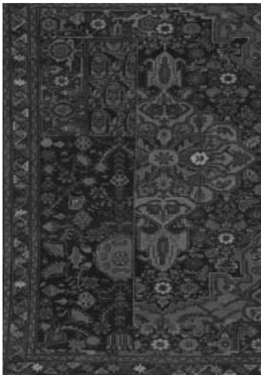
تصویر ۳. الف: اورنگ از منطقه روستای همدان

در برخی از اسناد هم دستبافته‌های روستایی در کنار امثال شهری بررسی و تعریف شده‌اند. با ملاحظه منابع مذکور و موارد مشابه، به نظر می‌رسد قالی‌های روستایی با نمونه‌های شهری و عشایری پیوندهای دیرینه‌ای دارند که حتی در مواردی عناصر شهری و عشایری در آن بسیار پررنگتر بوده و تمایز بین آن‌ها دشوار است. بنابراین با توجه به مراودات و تبادلات فرهنگی روستاییان با حوزه‌های همجوار، می‌توان عناصر عاریتی همسایگان را در نقوش فرش روستایی با دگرگونیهای محسوس شناسایی و بررسی کرد. از این جهت بدیهی است بخش مهمی از شاخصه‌های طرح و نقش قالی روستایی حاصل فرهنگ بومی و سنتهای فرش‌بافی و الگوهای زیستی و محیطی مناطق روستایی است. (تصاویر ۳-الف و ب)