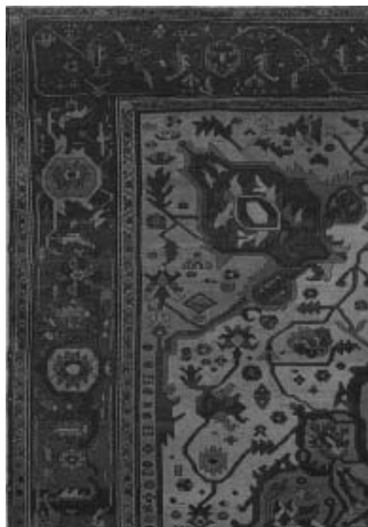
تصویر ۱-ب: نقش پردازي و تركيب نقوش در متن قالی روستايي هريس

در دستبافتهای عشایری (و نیز روستایی) علی‌رغم هندسی و شکسته بودن نقوش، نقشها از قابلیت کشش و تغییر و تبدیل به اشکال دیگر برخوردارند که این امر باعث ایجاد ترکیبات فراوان می‌شود. به کارگیری خطوط شکسته علاوه بر اینکه تجرید اشکال را تسهیل می‌کند، طرح و نقش قالی عشایری را در طبقه و سبک خاصی