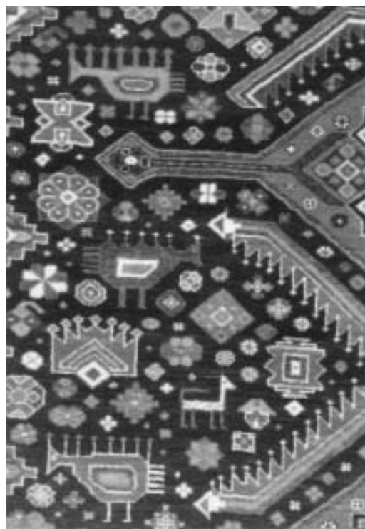
تصویر ۱-الف: نقش پردازي و تركيب نقوش در متن قالی عشایري فارس