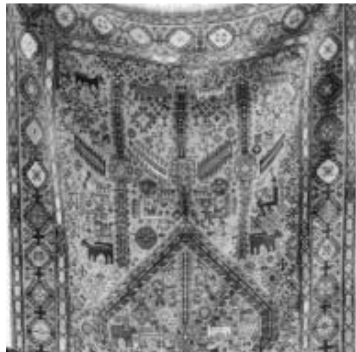
تصویر الف و ب: روایتی دیگر از احیای قالی شکرلو در دوره معاصر