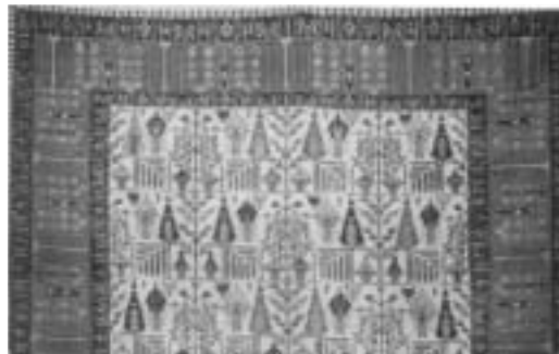
تصویر ۱-ج: نقش پردازی و ترکیب نقوش در متن و حاشیه قالی روستایی با طرح بید مجنون (شمال غرب ایران)

«این گونه زیر اندازها با وجود تنوعی که در طرح و رنگ دارد، عموماً ساده و با خطوط هندسی و شکسته و طرح و نقشی ذهنی و بدون تدوین مقدمات بافته می‌شود. زیبایی طبیعی، استحکام، اصالت طرح و نقش، ارزانی قیمت، مزایای فرش‌های روستایی عشایری است» (دانشگر، ۱۳۷۶: ۴۰۰).