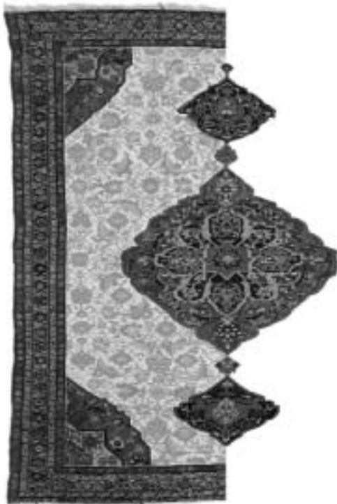
تصویر ۴: ساختار کلی و اجزای اصلی طرح در قالی عشایری فارس

هر چند آسیب‌شناسی در صنایع هنری ایران امری بی‌سابقه نیست اما در این مورد مطالعاتی عمیق و طولانی مطابق با خواسته‌های تعریفی که از آن آمد وجود ندارد؛ بویژه در امر احیا که خود هنوز نیازمند تحقیق و تدبیر بیشتری است و به نظر می‌رسد خلاءهای فراوانی در آن محتاج مطالعه بوده و تا به حال از آن غفلت شده است. از این جهت به همان میزان که احیای دستبافته‌ها به صورتی عمیق ارزیابی نشده و اغلب به بازسازی و بازبافی اکتفا شده، به تبع، شناخت انواع و میزان و تنوع آسیب‌های آن