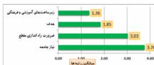
نمودار شماره ۲ رتبه بندی مولفه های اصلی پژوهش

در نمودار شماره ۲ میانگین رتبه‌های مولفه‌های اصلی پژوهش در بخش کمی قابل مشاهده است. یافته‌ها نشان می‌دهد نیازهای جامعه فرش در شرایط فعلی متنوع هستند اما لزوماً مقطع کارشناسی ارشد با وضعیت موجود نمی‌تواند یا نتوانسته به آن جامعه عمل بپوشاند لذا ضرورت بازنگری این مقطع را دو چندان می‌کند. از طرفی عمده مشکل در توجه به زیرساخت‌های فرهنگی و آموزشی در طرح و برنامه ریزی درسی این مقطع و تعریف واقعی اهداف مطابق با توانایی‌ها، ظرفیت‌ها و نیازهای جامعه بیان شده است.